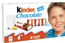
Шоколад КИНДЕР , 100 г