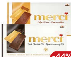
Шоколад МЕРСИ , горький, 72%/ Молочно-кофейный, 100 г