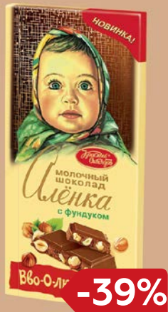
Шоколад АЛЕНКА Молочный с фундуком/ Молочный, 200 г