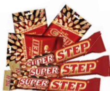
Конфеты СТЕП Супер глазированные, 65 г/ Арахис в шоколаде, 45 г