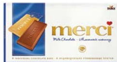
Шоколад молочный МЕРСИ , 100 г