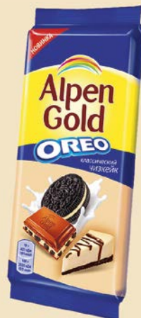
Шоколад АЛПЕН ГОЛД Орео молочный чизкейк и печенье, 95 г