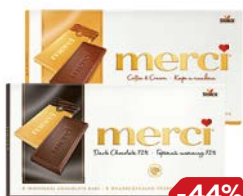
Шоколад МЕРСИ , горький, 72%/Молочно-кофейный, 100 г