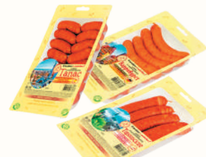
КОЛБАСКИ "ИНЕЙ": "ТАПАС" В/К, 280 ГР; "КАРРИВУРСТ" В/К, 280 ГР; "ТИРОЛЬСКИЕ" В/К, 250 ГР