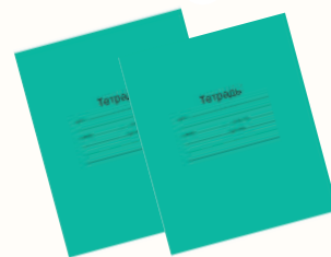
ТЕТРАДЬ ШКОЛЬНАЯ 12 ЛИСТ. (КЛЕТКА, ЛИНЕЙКА), 1 ШТ.