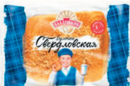
БУЛОЧКА "СВЕРДЛОВСКАЯ" "АЛАДУШКИН" "ДАРНИЦА", 100 ГР