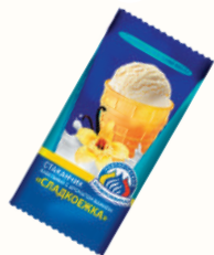
МОРОЖЕНОЕ "СЛАДКОЕЖКА" ВАНИЛЬНОЕ, 65 ГР