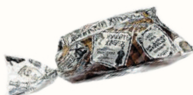
ИЗДЕЛИЕ Х/Б "ДВИНСКИЙ ЗАВАРНОЙ" НАРЕЗАННЫЙ, "ДАРНИЦА", 350 ГР