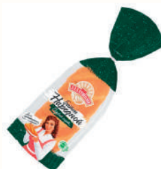
БАТОН "АЛАДУШКИН" НАРЕЗНОЙ 1 СОРТ "ДАРНИЦА", 350 ГР