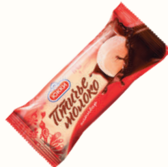
МОРОЖЕНОЕ ЭСКИМО "ЮККИ" ПЛОМБИР ПТИЧЬЕ МОЛОКО, 65 ГР