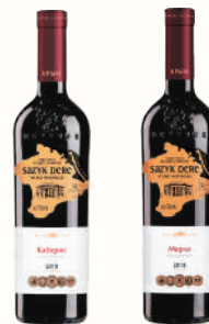
ВИНО В АССОРТИМЕНТЕ, 0,75 Л