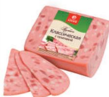
КОЛБАСА "КЛАССИЧЕСКАЯ С ТЕЛЯТИНОЙ" ВАР., ВНМД, 400 ГР