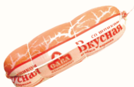
КОЛБАСА "ВКУСНАЯ СО ШПИКОМ" ВАР., САВА, 1 КГ