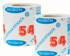
ТУАЛЕТНАЯ БУМАГА С ТИСНЕНИЕМ, 1 РУЛОН