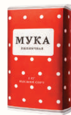
МУКА ВЫСШИЙ СОРТ, 2 КГ

Ждём Вас с 08:00 до 02:00 по адресам: Санкт-Петербург, м. "Ладожская", пр. Косыгина, 21, м. "Пр. Просвещения", ул. Хошимина, 14