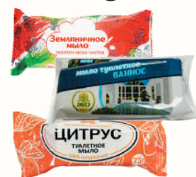
МЫЛО ТУАЛЕТНОЕ В АССОРТИМЕНТЕ 75-90 ГР, 1 ШТ.