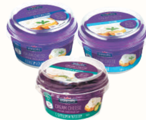
ТВОРОЖНЫЙ СЫР "ЭМБОРГ" МЯГКИЙ СЛИВОЧНЫЙ В АССОРТИМЕНТЕ, 150 ГР