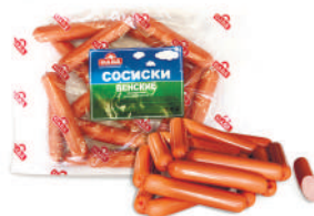
СОСИСКИ "ВЕНСКИЕ" ОХЛ., САВА, 1 КГ