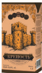
ВИНО ФРУКТОВОЕ СТОЛОВОЕ "КРЕПОСТЬ" П/СЛ., 1 Л