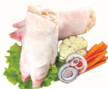
НОГИ СВИНЫЕ С/М, 1 КГ