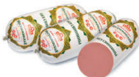
КОЛБАСА "МУСУЛЬМАНСКАЯ" ВАР., САВА, 1 КГ