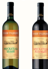
ВИНО ЛИКЕРНОЕ "МУСКАТЕЛЬ" БЕЛОЕ, РОЗОВОЕ 16%, 0,75 Л