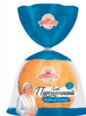
ХЛЕБ ПШЕНИЧНЫЙ "ЧЕСТНЫЙ СОСТАВ" ПОДОВЫЙ НАРЕЗАННЫЙ "ДАРНИЦА", 400 ГР