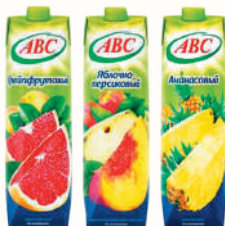
СОКИ И НЕКТАРЫ "ABC" В АССОРТИМЕНТЕ, 1 Л