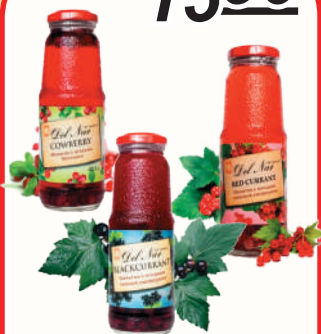
НАПИТОК "ДЕЛ НАР" В АССОРТИМЕНТЕ, 250 МЛ