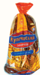
ХЛЕБ "ПЕТРОХЛЕБ" КУПЕЧЕСКИЙ ЗАВАРНОЙ НА РЖАНОМ СОЛОДЕ, "ВОЛХОВХЛЕБ", 500 ГР