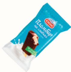
МОРОЖЕНОЕ ЭСКИМО "ЮККИ" ПЛОМБИР НА СЛИВКАХ, 65 ГР