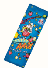
МОРОЖЕНОЕ СЛАДКИЙ ЛЕД "ДАЙ" КЛУБНИКА-ЛАЙМ, 70 ГР