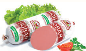
КОЛБАСА "НОВАЯ" САВА, ВАР., 1 КГ