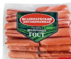
Сосиски МОЛОЧНЫЕ , ГОСТ (Великолуцкий МК), 650 г