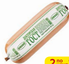
Колбаса ДОКТОРСКАЯ , ГОСТ (Велико- луцкий МК), 500 г