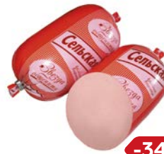
Колбаса СЕЛЬСКАЯ , Вареная, мини (Царицыно), 400 г