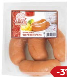
Шпикачки ДЕРЕВЕНСКИЕ , Дым Дымыч, Мини (Агротэк), 100 г

* Цена за единицу товара при единовременной покупке 2 одинаковых акционных товаров