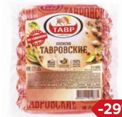
Сосиски ТАВРОВСКИЕ (Тавр), 600 г