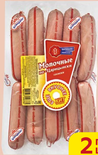
Сосиски МОЛОЧНЫЕ , По-царицынски, мини (Царицыно), 550 г