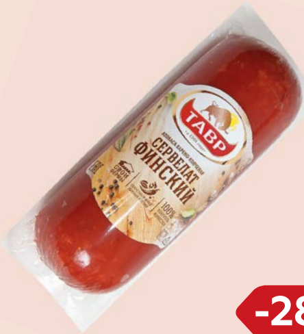
Сервелат ФИНСКИЙ , Варено-копченый, мини (Тавр), 350 г