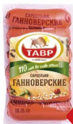
Сардельки ГАННОВЕРСКИЕ , Мини (Тавр), 600 г