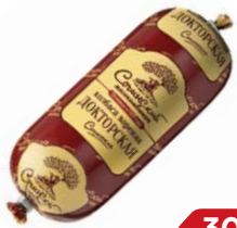
Колбаса ДОКТОРСКАЯ Вареная (Сочинский МК), 450 г

* Цена за единицу товара при единовременной покупке 2 одинаковых акционных товаров