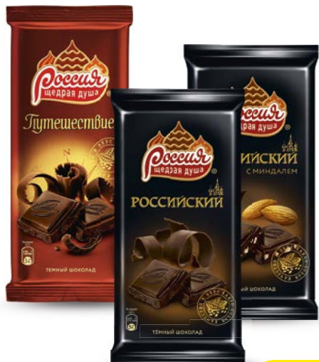
Шоколад РОССИЙСКИЙ , в ассортименте*, 90 г