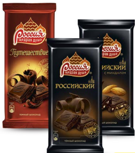
Шоколад РОССИЙСКИЙ , в ассортименте*, 90 г