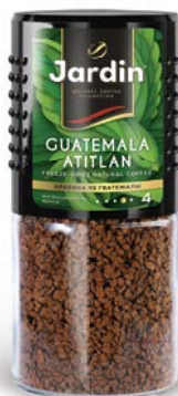
Кофе ЖАРДИН , Гватемала Атитлан, 95 г