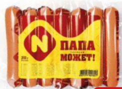
Сосиски ПАПА МОЖЕТ (ОМПК), 350 г