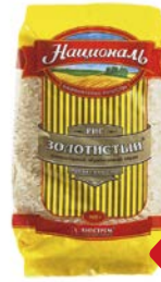
Рис НАЦИОНАЛЬ , Золотистый, 900г