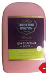
Колбаса ДОКТОРСКАЯ , вареная ГОСТ (Заповедные продукты), 400 г

* Цена за единицу товара при единичной покупке 2 одинаковых экземпляров товара