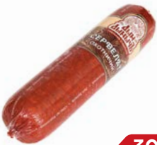
Сервелат ОХОТНИЧИЙ Дым Дымычъ варено-копченый, мини (Агротэк), 350 г