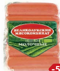
Сардельки МОЛОЧНЫЕ (Великолукский МК), 500 г