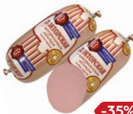
Колбаса ДОКТОРСКАЯ , с натуральным молоком, мини (Царицыно), 500 г