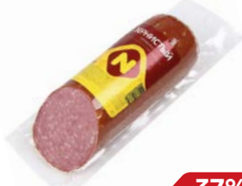
Сервелат ЗЕРНИСТЫЙ , Варено-копченый (ОМПК), 420 г