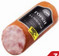
Колбаса БАЛЫКОВАЯ варено-копченая (Ближние горки), 490 г