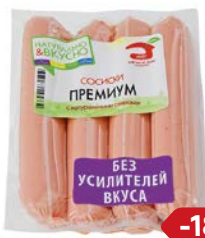
Сосиски ПРЕМИУМ с натуральными сливками (МДБ), 480 г