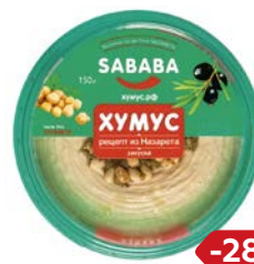
Хумус САБАВА Рецепт из Наза- рета, 150 г