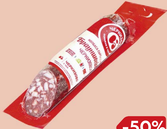
Колбаса БРАУНШВЕЙГСКАЯ- ЧЕРКИЗОВСКАЯ , мини, сырокопче- ная (ЧМПЗ), 300 г

* Цена за единицу товара при единичной покупке 2 одинаковых экземпляров товара