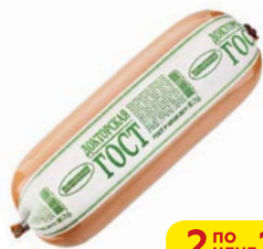
Колбаса ДОКТОРСКАЯ , ГОСТ (Велико- лукский МК), 500 г