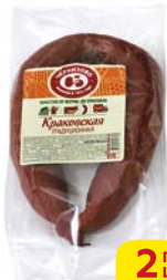
Колбаса КРАКОВСКАЯ , традиционная полукопченая (Черкизовский МПЗ), 400 г