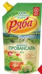
Майонез РЯБА, Провансаль, 67%, 233 г