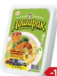
Лапша ДОШИРАК, Курица, 90 г