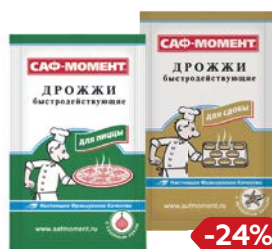
Дрожжи САФ-МОМЕНТ для пиццы/ для сдобы, 12 г