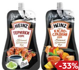
Соус ХАЙНЦ, Терияки/ Кисло- сладкий/ Сладкий чили, 230 г