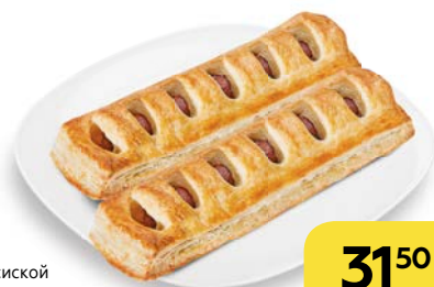
ДЕНИШ с сосиской и горчицей XXL, 125 г