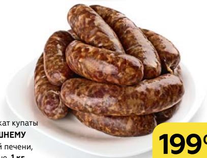
Полуфабрикат купаты ПО-ДОМАШНЕМУ из говяжьей печени, охлажденные, 1 кг