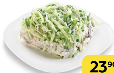
Салат ФАВОРИТ , 100 г