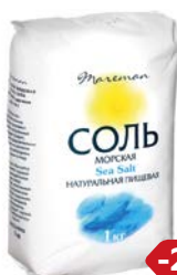
Соль морская МАРЕМАН, Средняя, 1 кг