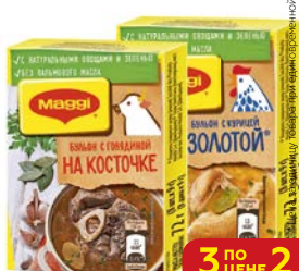
Кубик бульонный МАГГИ® Куриный/ Говядина на кости/ С лесными грибами, 72 г