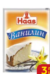
Ванилин ХААС, 1,5 г