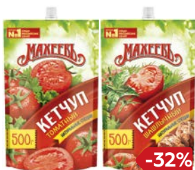
Кетчуп МАХЕЕВЪ, Томатный/ Шашлычный/ Татарский, 500 г