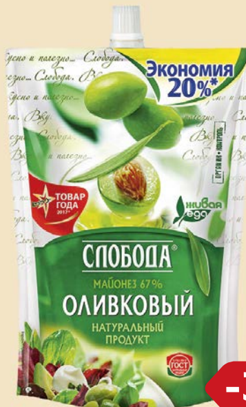
Майонез СЛОБОДА, Оливковый, 67%, 750 г