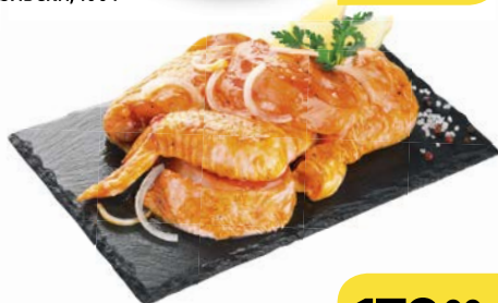
Полуфабрикат ШАШЛЫК КУРИНЫЙ , в маринаде, охлажденный, 1 кг