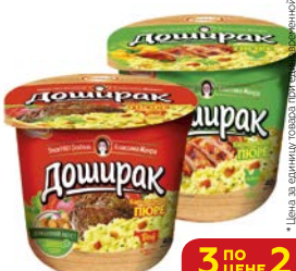
Пюре картофе- льное ДОШИРАК, Со вкусом: Курицы/ Мясa, 40 г