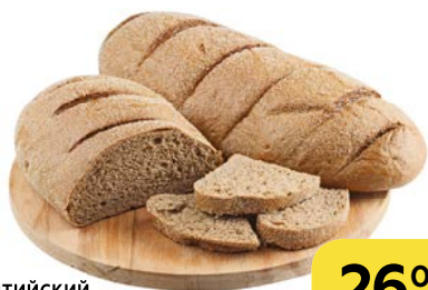
Хлеб ПРИБАЛТИЙСКИЙ ТЕМНЫЙ , 300 г