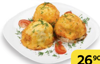
Отбивная ПО-КРИОЛЬСКИ , 100 г