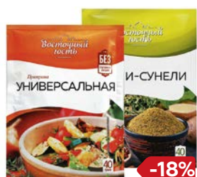
Приправа ВОСТОЧНЫЙ ГОСТЬ, Хмели- сунели/ Универ- сальная, 40 г