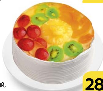
Торт СМЕТАННЫЙ, бисквитный , 900 г