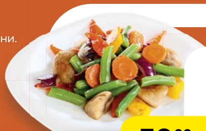
Овощи ПО-АЗИАТСКИ , 100 г

Семья магазинов «Магнит». Давайте дружить семьями!