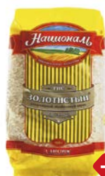
Рис НАЦИОНАЛЬ, Золотистый, 900 г