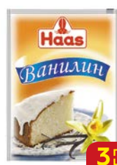
Ванилин ХААС, 1,5 г