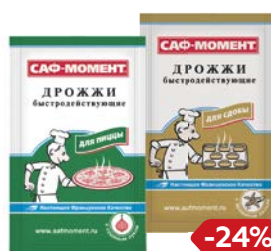
Дрожжи САФ-МОМЕНТ для пиццы/ для сдобы, 12 г