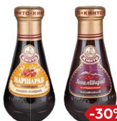
Соус КИНТО, Нарша- раб, гранатовый/ Нарша- раб, сладко-острый, 380 г; Золотшараб кизилковый, 370 г