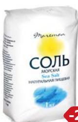
Соль морская МАРЕМАН, Средняя, 1 кг