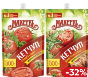
Кетчуп МАХЕЕВЬ, Томатный/ Шашлычный/ Татарский, 500 г