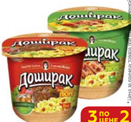
Пюре картофе- льное ДОШИРАК, Со вкусом: Курицы/ Мясa, 40 г