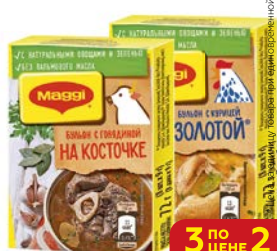
Кубик бульонный МАГГИ® Куриный/ Говядина на кости/ С лесными грибами, 72 г