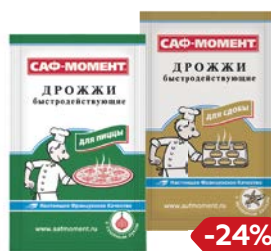
Дрожжи САФ-МОМЕНТ для пиццы/ для сдобы, 12г