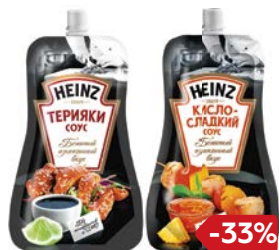
Соус ХАЙНЦ, Терияки/ Кисло- сладкий/ Сладкий чили, 230 г