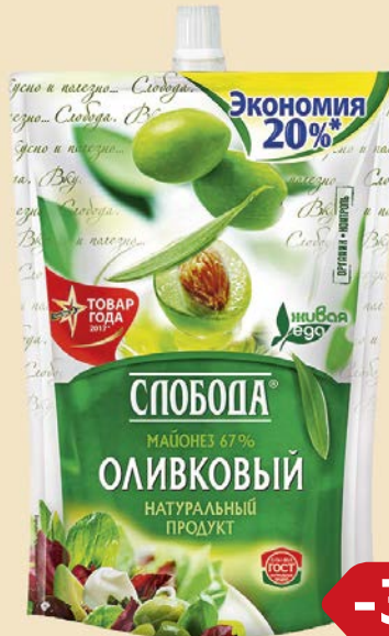
Майонез СЛОБОДА, Оливковый, 67%, 750 г