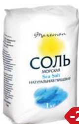
Соль морская МАРЕМАН, Средняя, 1кг