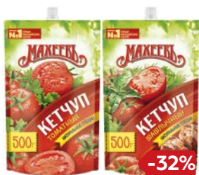
Кетчуп МАХЕЕВЬ, Томатный/ Шашлычный/ Татарский, 500 г