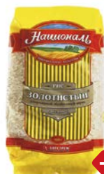
Рис НАЦИОНАЛЬ, Золотистый, 900 г