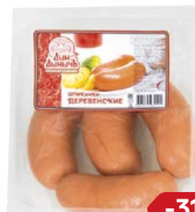
Шликачки ДЕРЕВЕНСКИЕ, Дым Дымыч, Мини (Агротэк), 100 г