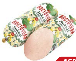
Колбаса ВОСТОЧНАЯ Халляль вареная (Чебаркульская Птица), 400 г