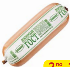
Колбаса ДОКТОРСКАЯ, ГОСТ (Велико- лукский МК), 500 г