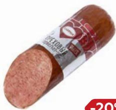
Сервелат ОРЕХОВЫЙ, Варено-копченый (Таврия), 350 г

* Цена за единицу товара при единичной покупке 2-х любых акционных товаров