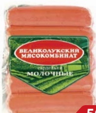
Сардельки МОЛОЧНЫЕ (Великолукский МК), 500 г