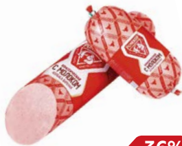
Колбаса КЛАССИЧЕСКАЯ, С молоком, вареная (Ромкор), 100 г