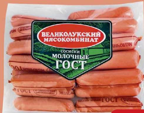
Сосиски МОЛОЧНЫЕ, ГОСТ (Великолукский МК), 650 г