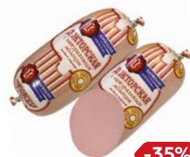
Колбаса ДОКТОРСКАЯ, с натуральным молоком, мини (Царицыно), 500 г