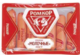
Сосиски МОЛОЧНЫЕ, ГОСТ (Ромкор), 350 г