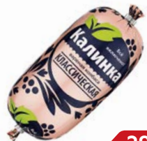
Колбаса КЛАССИЧЕСКАЯ, Вареная (Калинка), 400 г