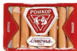
Сосиски СЛИВОЧНЫЕ, Подкопченные (Ромкор), 370 г