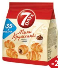
Круассаны 7DAYS®, мини, С кремом какао, 300 г