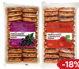
Палочки сдобные LUCKY DAYS® Черная смородина/Земляника 370 г