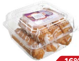
Пирожные ЭКЛЕРЫ, с крем-брюле (Хлебпром), 180 г