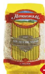
Рис НАЦИОНАЛЬ , Золотистый, 900 г