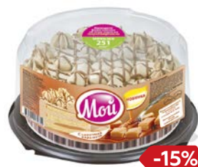
Торт МОИ, Сливочная Карамель (Хлебпром), 700 г