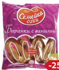
Баранки СЕМЕЙКА ОЗБИ, Ванильные, 300 г