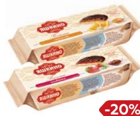
Печенье сдобное ЯШКИНО, Клубника/Апельсин, 137 г