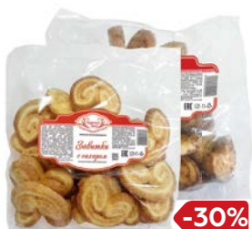
Завитки ЧУДЕСНЫЙ КРАЙ Слоенные: С корицей/С сахаром/С маком, 250 г