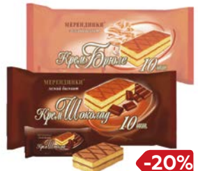
Пирожное МЕРЕНДИНКИ, сливочное/шоколадное/крем-брюле, 360 г