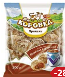
Пряники КОРОВКА, С начинкой Вареная сгущенка (Рот Фронт), 300 г