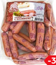
Сосиски С МОЛОКОМ, Дым Дымыч (Агротэк), 100 г