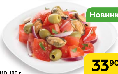
Салат СУПРЕМО , 100 г