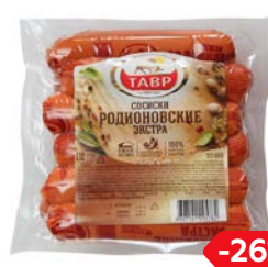
Сосиски РОДИОНОВСКИЕ, Экстра, мини (Тавр), 600 г