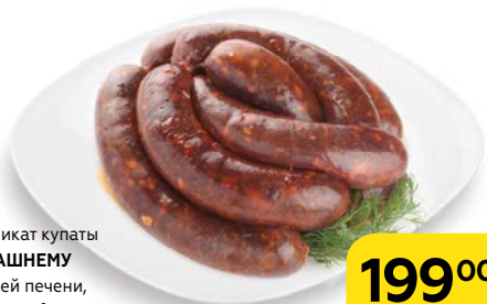
Полуфабрикат купаты ПО-ДОМАШНЕМУ из говяжьей печени, охлажденные, 1 кг