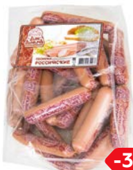
Сосиски РОССИЙСКИЕ, Дым Дымыч (Агротэк), 100 г