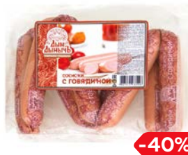
Сосиски ДЫМ ДЫМЫЧ, С говядиной (Агротэк), 400 г