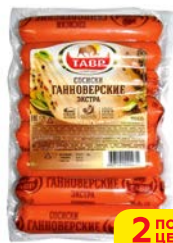
Сосиски ГАННОВЕРСКИЕ, Экстра (Тавр), 430 г