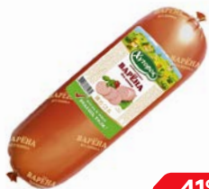
Колбаса ВАРЁНА, Хуторок, без шпика, мини (Реги- онэкопродукт), 100 г