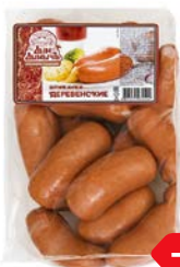
Шпикачки ДЕРЕВЕНСКИЕ, Дым Дымыч (Агротэк), 100 г