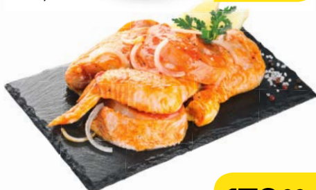
Полуфабрикат ШАШЛИК КУРИНЫЙ , в маринаде, охлажденный, 1 кг