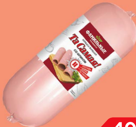
Колбаса ТА САМАЯ, варе- ная, со шпиком (Фамильные колбасы), 100 г