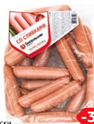
Сосиски СО СЛИВКАМИ, Классические, Генеральские колбасы (Агротэк), 100 г