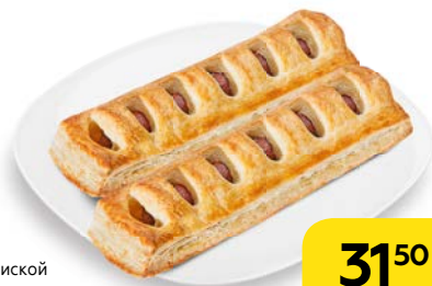
ДЕНИШ с сосиской и горчицей XXL, 125 г