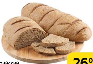
Хлеб ПРИБАЛТИЙСКИЙ ТЕМНЫЙ , 300 г