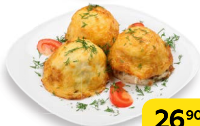
Отбивная ПО-КРИОЛЬСКИ , 100 г