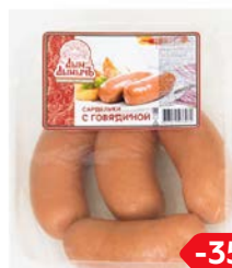
Сардельки С ГОВЯДИНОЙ, Дым Дымыч, Мини (Агротэк), 100 г