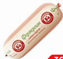
Колбаса ФЕРМЕРСКАЯ, Вареная (ЧМПЗ), 500 г