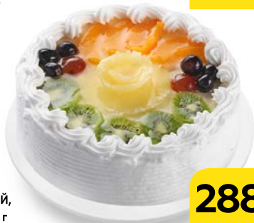
Торт СМЕТАННЫЙ, бисквитный , 900 г