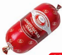
Колбаса ЛЮБИТЕЛЬСКАЯ, Вареная (Тавр), 700 г