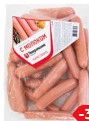
Сосиски КЛАССИЧЕСКИЕ, С молоком (Агротэк), 100 г