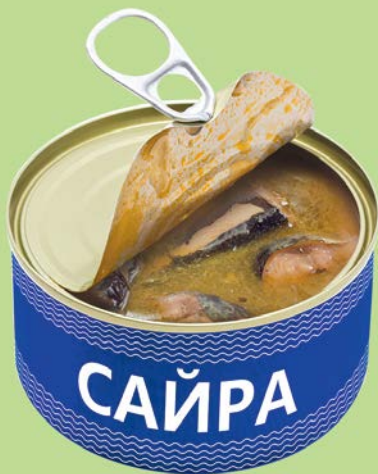
САЙРА натуральная с добавлением масла, 230 г