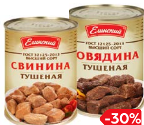
ГОВЯДИНА ТУШЕНАЯ/ СВИНИНА ТУШЕНАЯ, ГОСТ, высший сорт (Елининский п/к), 338 г