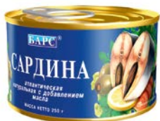
Сардина БАРС Атлантическая натуральная с добавлением масла, 250 г