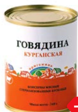
Говядина тушёная КУРГАНСКАЯ (КМК Стандарт), 340 г