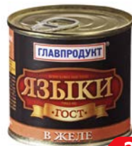
Языки в желе, ГЛАВПРОДУКТ , 250 г