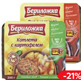
БЕРИЛОЖКА Обед готовый, Рис с курицей и ово- щами/ Котлета с картофелем, 250 г