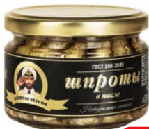
Шпроты КАПИТАН ВКУСОВ в масле, 250 г