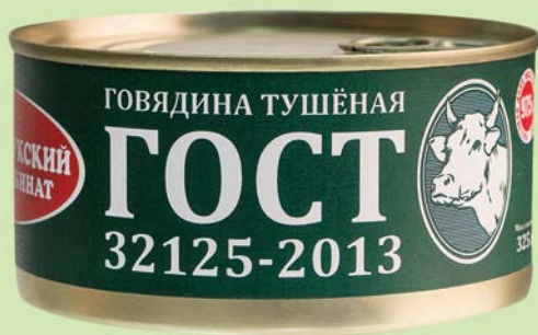
Говядина ВЕЛИКОЛУКСКИЙ МК Тушёная, 325 г