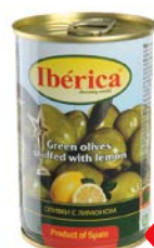
Оливки ИБЕРИКА , Зеленые с лимо- ном, 300 г