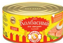
Фарш куриный КОЛБАСНЫЙ , Для завтрака (Золотой петушок), 325 г