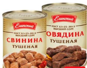
ГОВЯДИНА ТУШЕНАЯ/ СВИНИНА ТУШЕНАЯ, ГОСТ, высший сорт (Елинский п/к), 338 г