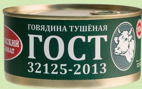
Говядина ВЕЛИКОЛУКСКИЙ МК Тушёная, 325 г