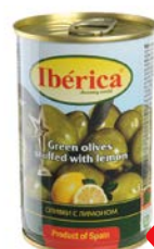
Оливки ИБЕРИКА , Зеленые с лимо- ном, 300 г