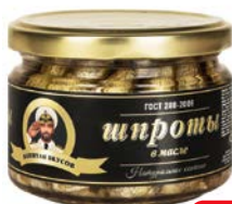
Шпроты КАПИТАН ВКУСОВ в масле, 250 г