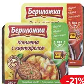
БЕРИЛОЖКА Обед готовый, Рис с курицей и ово- щами/ Котлета с картофелем, 250 г