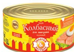
Фарш куриный КОЛБАСНЫЙ, Для завтрака (Золотой петушок), 325 г