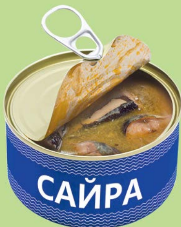
САЙРА натуральная с добавлением масла, 230 г