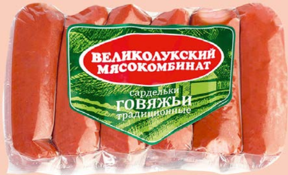
Сардельки ГОВЯЖЬИ, Традиционные, (Великолуцкий МК), 600 г