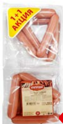
Сосиски МОЛОЧНЫЕ Традиционные 1+1 (Кунгурский МК), 660 г