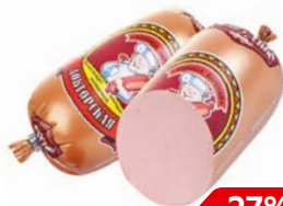
Колбаса ДОКТОРСКАЯ, Мини (Кунгурский МК), 400 г