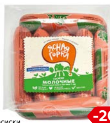
Сосиски МОЛОЧНЫЕ, Ясная горка из мяса птицы (ПФ Пермская), 480 г