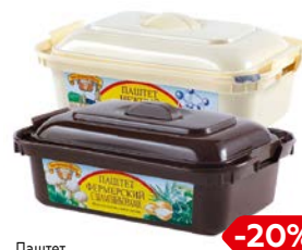
Паштет ПАТЕ ГРАНД-МЭР печеночный; Фермерский с шам- пиньонами/ Нежный по-домашнему, 150 г