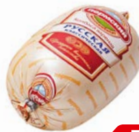
Колбаса РУССКАЯ, Классическая вареная, мини (Пермский МК), 400 г