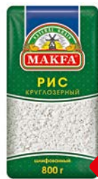
Рис МАКФА ®, Круглозерный шлифованный, 800г