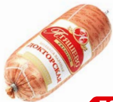
Колбаса ДОКТОРСКАЯ, вареная, премиум (МПК Атяшевский), 500 г