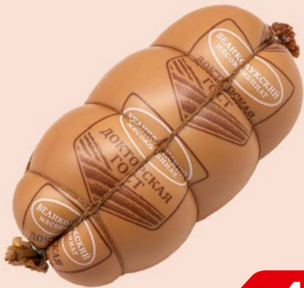
Колбаса ДОКТОРСКАЯ, ГОСТ вареная (Великолуцкий МК), 500 г