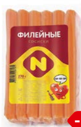
Сосиски ФИЛЕЙНЫЕ, Из мяса птицы, вареные (ОМПК), 270 г