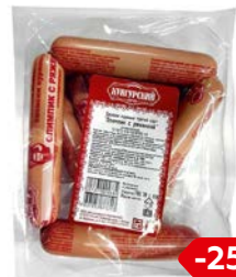
Сосиски ОЛИМПИК, с ряженкой (Кунгурский МК), 590 г