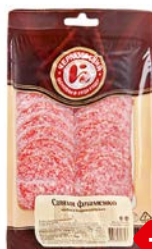
Салами ФЛАМЕНКО , Сырокопченая, нарезка, (Чер- кизовский МПЗ), 100г