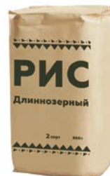
РИС длиннозерный, 800г