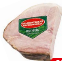
Окорок ТАМБОВСКИЙ , ГОСТ, варено- копченый (Велико- лукский МК), 300г