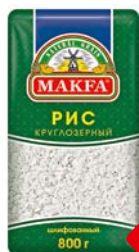
Рис МАКФА ®, Круглозерный шлифованный, 800г