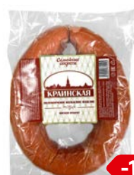
Колбаса СЕМЕЙНЫЕ СЕКРЕТЫ Краинская, Полу- копченая, 500г