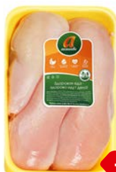
Филе цыпленка- бройлера АКАШЕВО , охлажденное (Акашевская ПТФ), 1кг