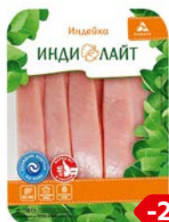
Стейк ИНДИЛАЙТ , из грудки индейки, охлажденный, 525г