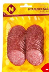
Салами ИТАЛЬЯНСКАЯ , нарезка сырокопченая (ОМПК), 150г