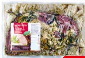
Лопатка для запекания ДОМАШНЯЯ , Охлажденная (Мираторг), 1кг