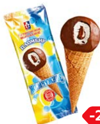
Мороженое ЖЕМЧУЖНОЕ, Карамельное, в рожке, 80 г

* Цена за единицу товара при стандартной покупке 2 отдельных одинаковых товаров