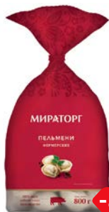
Пельмени МИРАТОРГ, Фермерские, 800 г