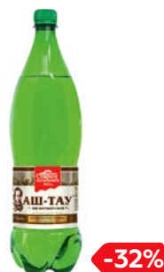
Вода минеральная АШ-ТАУ, Газированная, 1,5 л