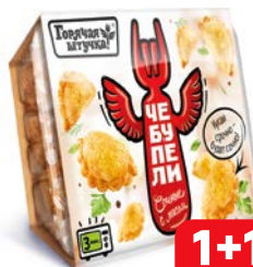
Чбупели ГОРЯЧАЯ ШТУЧКА С мясом, 300 г