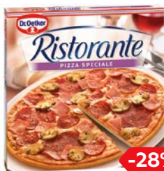
Пицца РИСТОРАНТЕ, специале (Д-р Оеткер), 330 г

* Цена за единицу товара при стандартной покупке 2 отдельных одинаковых товаров