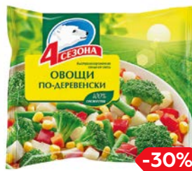
Смесь овощная 4 СЕЗОНА, Овощи по-деревенски, заморожен- ные, 400 г