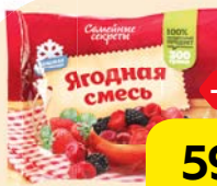
Смесь ягодная СЕМЕЙНЫЕ СЕКРЕТЫ, замороженная, 300 г