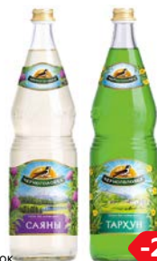
Напиток газированный НАПИТКИ ИЗ ЧЕРНОГОЛОВКИ, В ассортименте***, 1л