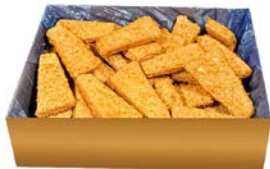
ТРЕУГОЛЬНИКИ ЛОСОСЕВЫЕ в панировке (Полар ООО), 1кг