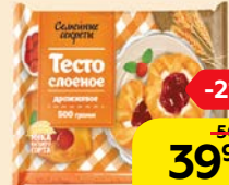
Тесто слоеное СЕМЕЙНЫЕ СЕКРЕТЫ, Дрожжевое, 500 г