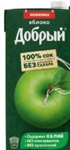
Соки и нектары ДОБРЫЙ, в ассортименте***, 2л