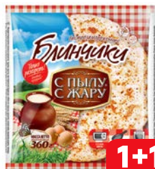
Блинчики С ПЫЛУ С ЖАРУ без начинки, 360г