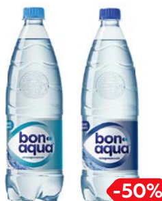
Вода питьевая БОН АКВА, Негазированная/Газированная, 1л