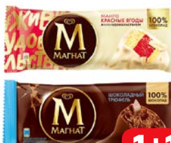
Мороженое МАГНАТ, Эскимо: Шоколадный трю- фель, 72 г; Миндаль, 73 г; Манго-красные ягоды, 70 г