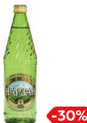
Вода минеральная НАРЗАН, Негазированная, 500 мл