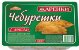
Чбурешки ЖАРЕНКИ с мясом (Морозко), 300 г