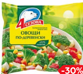
Смесь овощная 4 СЕЗОНА, Овощи по-деревенски, замороженные, 400 г