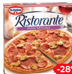
Пицца РИСТОРАНТЕ, специале (Д-р Оеткер), 330 г

* Цена за единицу товара при одинарной покупке с оригинальным этикетным товаром