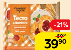
Тесто слоеное СЕМЕЙНЫЕ СЕКРЕТЫ, Дрожжевое, 500 г