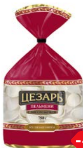
Пельмени ЦЕЗАРЬ, с мясом бычков, 750 г

* Цена за единицу товара при одинарной покупке с оригинальным этикетным товаром