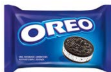
Мороженое ОРЕО, с печеньем, 80 г