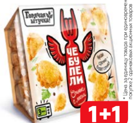
Чебупели ГОРЯЧАЯ ШТУЧКА С мясом, 300 г