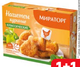
Наггетсы куриные МИРАТОРГ, Классические, 300 г