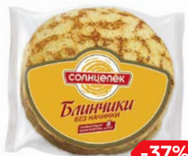
Блинчики СОЛНЦЕПЕК, без начинки (Сибирский Гурман), 360 г