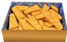
Треугольники лососевые в панировке (Полар ООО), 1 кг