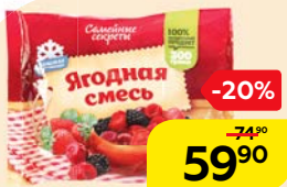
Смесь ягодная СЕМЕЙНЫЕ СЕКРЕТЫ, замороженная, 300 г