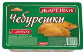
Чебурешки ЖАРЕНКИ с мясом (Морозко), 300 г