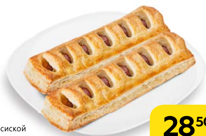
ДЕНИШ с сосиской и кетчупом XXL, 125 г