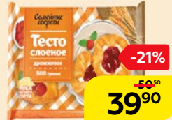
Тесто слоеное СЕМЕЙНЫЕ СЕКРЕТЫ, Дрожжевое, 500 г