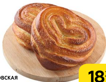
Плюшка МОСКОВСКАЯ классическая, 100 г