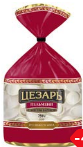
Пельмени ЦЕЗАРЬ, с мясом бычков, 750 г