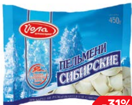
Пельмени СИБИРСКИЕ (Июшкар-Олинский МК), 450 г