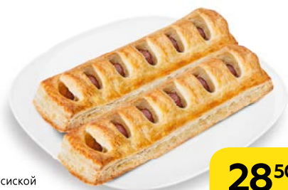
ДЕНИШ с сосиской и кетчупом XXL, 125 г