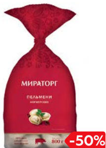
Пельмени МИРАТОРГ, Фермерские, 800 г