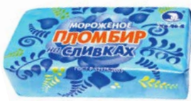
Мороженое ЧЕЛНЫ ХОЛОД, Пломбир на сливках, 200 г

* Цена за единицу товара при одновременной покупке 2-х аналогичных товаров