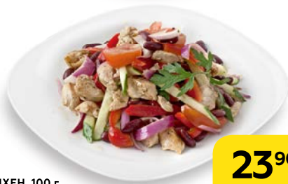
Салат МЮНХЕН, 100 г