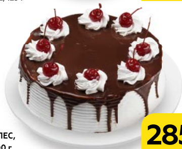
Торт ЧЁРНЫЙ ЛЕС, бисквитный, 900 г