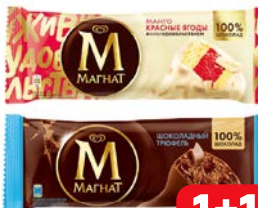
Мороженое МАГНАТ, Эскимо: Шоколадный трюфель, 72 г; Миндаль, 73 г; Манго-красные ягоды, 70 г