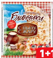
Блинчики С ПЫЛУ С ЖАРУ без начинки, 360 г