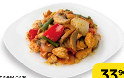
СОТЕ с куриным филе и овощами, 100 г