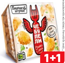
Чебупели ГОРЯЧАЯ ШТУЧКА С мясом, 300 г

* Цена за единицу товара при одновременной покупке 2-х аналогичных товаров