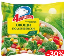
Смесь овощная 4 СЕЗОНА, Овощи по-деревенски, замороженные, 400 г