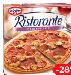
Пицца РИСТОРАНТЕ, специале (Д-р Оеткер), 330 г

* Цена за единицу товара при одновременной покупке 2-х аналогичных товаров