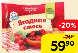
Смесь ягодная СЕМЕЙНЫЕ СЕКРЕТЫ, замороженная, 300 г