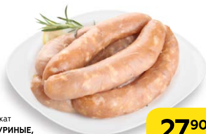
Полуфабрикат КУПАТЫ КУРИНЫЕ, охлажденные, 100 г