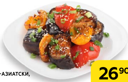
Овощи ПО-АЗИАТСКИ, 100 г