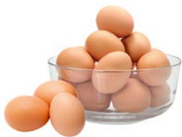
ЯЙЦО СТОЛОВОЕ СО (МД Россия), 10 шт.