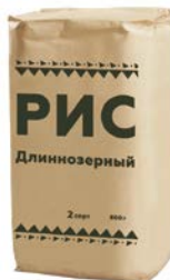
РИС длиннозерный, 800г