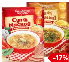
Суп СЕМЕЙНЫЕ СЕКРЕТЫ/ Куриный/ Мясной, 60 г