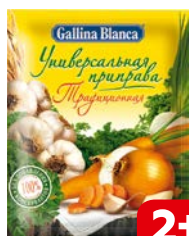
Универсальная приправа ГАЛЛИНА БЛАНКА Традиционная, 75 г