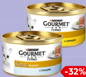
Корм для кошек GOURMET®, Голд, Паштет: Стунцом/ С курицей, 85 г