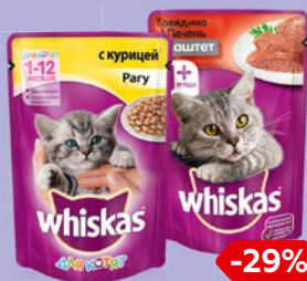
Корм для кошек WHISKAS®, В ассортименте***, 85 г