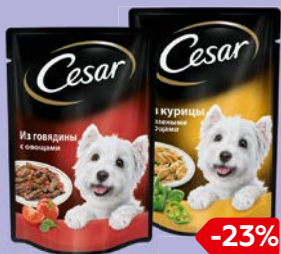
Корм для собак ЦЕЗАРЬ, в ассорти- менте***, 100 г