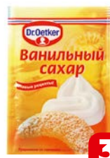
Сахар DR. OETKER® Ванильный, 8 г