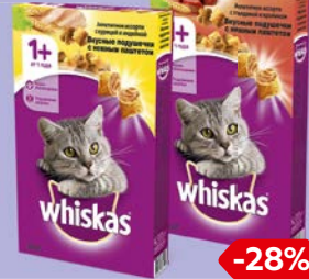
Корм для кошек WHISKAS®, В ассортименте***, 350 г