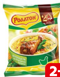
Лапша РОЛЛТОН, со вкусом курицы, 60 г