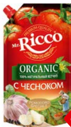
Кетчуп МИСТЕР РИККО, Помodoro Специале Органик с чесноком, 350 г