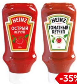
Кетчуп ХАЙНЦ Острый/ Томатный, 570 г