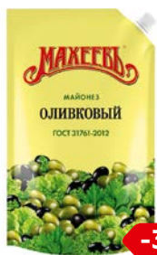
Майонез МАХЕЕВ, Оливковый, 50,5%, 770 г