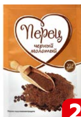
ПЕРЕЦ ЧЕРНЫЙ, молотый, 20 г