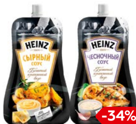
Соус ХАЙНЦ, Сырный/ Чесноч- ный/ Цезарь, 230 г