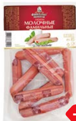
Сосиски МОЛОЧНЫЕ (Фамильные колбасы), 600 г