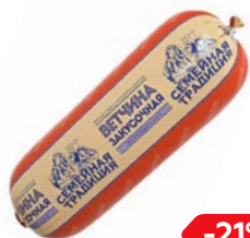
Ветчина ЗАКУСОЧНАЯ (Тавр), 100 г