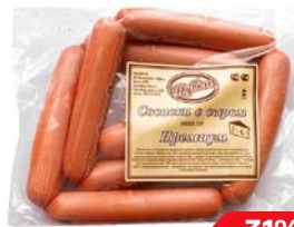
Сосиски ПРЕМИУМ С сыром (Дубки), 500 г