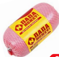
Ветчина ПАПА МОЖЕТ (ОМПК), 400 г