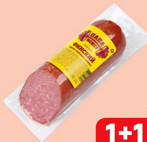
Сервелат ФИНСКИЙ , Папа Может, варено-копченный (ОМПК), 420 г