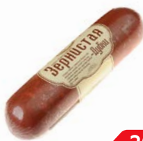
Колбаса ЗЕРНИСТАЯ, Варено-копченая, мини (Дубки), 300 г

* Цена за единицу товара при одновременной покупке 2 оригинальных товаров