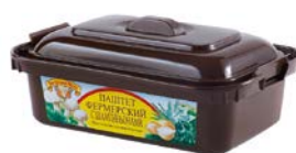
Паштет ПАТЕ ГРАНД-МЭР печеночный фермерский с шампиньонами, 150 г