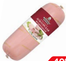
Колбаса ДОКТОРСКАЯ, (Фамильные колбасы), 100 г