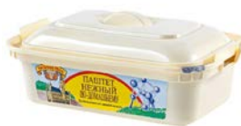
Паштет ПАТЕ ГРАНД-МЭР печеночный нежный по-домашнему, 150 г