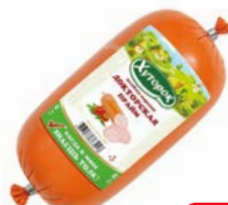
Колбаса ДОКТОРСКАЯ Прайм, вареная, хуторок (Фамильные колбасы), 600 г