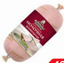
Колбаса МОЛОЧНАЯ Вареная, мини (Фамильные Колбасы), 400 г