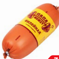
Колбаса ФИЛЕЙНАЯ, Вареная (Папа может), 500 г