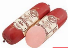
Колбаса ДОКТОРСКАЯ Вареная (Дубки), 100 г