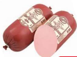
Колбаса ДОКТОРСКАЯ Вареная (Дубки), 500 г