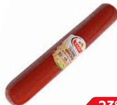
Салыма ФИНСКАЯ, Варено-копченая, с можжевелником (Тавр), 100 г