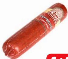
Сервелат ЦАРСКИЙ, Дым Дымыч, варено-копченый, мини (Агротэк), 350 г