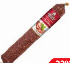
Салями АВСТРИЙСКАЯ , Сырокопченая, Премиум, мини (Фамильные колбасы), 100 г