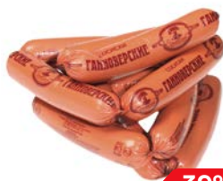
Сосиски ГАННОВСКИЕ (Сочинский МК), 100 г