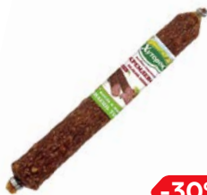
Колбаса КРЕМЛЕВСКАЯ , Сырокопченая (Хуторок), 180 г