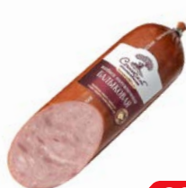
Колбаса БАЛЫКОВАЯ полукопченая (Сочинский МК), 400 г