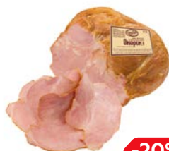
ОКОРОК варено-копченный (Дубки), 100 г