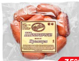
Шликачки ПРЕМИУМ, Высший сорт (Дубки), 500 г