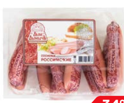
Сосиски РОССИЙСКИЕ, Дым Дымыч (Агротэк), 500 г