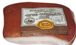
Щеки ЗАКУСОЧНЫЕ , варено-копченые (Донские Традиции), 100 г