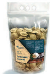
ПЕЛЬМЕНИ "ЗАСТОЛЬНЫЕ" КАТ. В, 1500 ГР