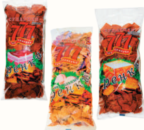
СУХАРИКИ-ГРЕНКИ "ТРИ СЕМЕРКИ" В АССОРТИМЕНТЕ, 500 ГР