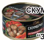
СКУМБРИЯ В Т/С С ОВОЩ. ГАРНИРОМ "ЗА РОДИНУ", 185 ГР