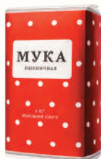
МУКА ВЫСШЕЙ СОРТ, 2 КГ