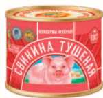
СВИНИНА ТУШЕНАЯ ГОСТ КТК, 525 ГР