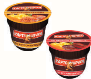
ПЮРЕ "КАРТОШЕЧКА" СО ВКУСОМ КУРИЦЫ; ГОВЯДИНЫ, 41 ГР