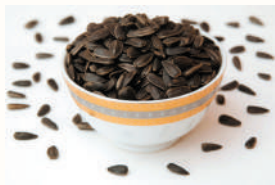
СЕМЕНА ПОДСОЛНЕЧНИКА НЕОЧИЩЕННЫЕ, 1 КГ