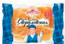
БУЛОЧКА "СВЕРДЛОВСКАЯ" "АЛАДУШКИН" "ДАРНИЦА", 100 ГР