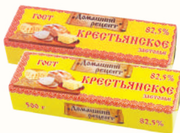
СПРЕД "КРЕСТЬЯНСКОЕ ЗАСТОЛЬЕ" 82,5%, 500 ГР