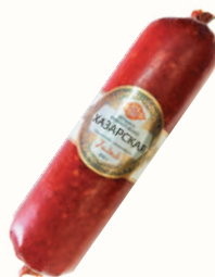
КОЛБАСА "ХАЗАРСКАЯ" П/К, СОВАД, 400 ГР