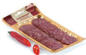
КОЛБАСА "ОХОТНИЧЬЯ" С/К, АНКОН, 100 ГР