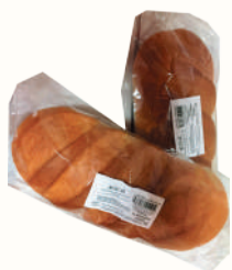
БАТОН НАРЕЗНОЙ 1 СОРТ "ВОЛХОВХЛЕБ", 300 ГР