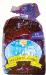
ХЛЕБ "МОНАСТЫРСКИЙ" "ВОЛХОВХЛЕБ", 300 ГР