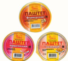
ПАШТЕТ В АССОРТИМЕНТЕ, ВНМД, 90 ГР