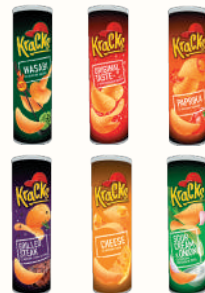
ЧИПСЫ "КРАКС" В АССОРТИМЕНТЕ, 160 ГР