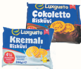
ПЕЧЕНЬЕ-СЭНДВИЧ "ЧОКОЛЕТТО" КРЕМАЛИ В АССОРТИМЕНТЕ, 244 ГР