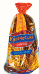
ХЛЕБ "ПЕТРОХЛЕБ" КУПЕЧЕСКИЙ ЗАВАРНОЙ НА РЖАНОМ СОЛОДЕ, "ВОЛХОВХЛЕБ", 500 ГР