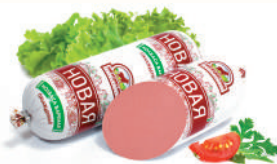
КОЛБАСА "НОВАЯ" САВА, ВАР., 1 КГ