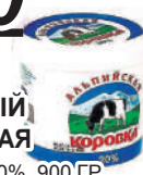
ПРОДУКТ СМЕТАННЫЙ "АЛЬПИЙСКАЯ КОРОВКА" 20%, 900 ГР