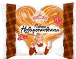
ПЛЮШКА "НОВОМОСКОВСКАЯ" "АЛАДУШКИН" "ДАРНИЦА", 200 ГР