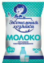
МОЛОКО ПИТЬЕВОЕ 1,5%, 900 МЛ