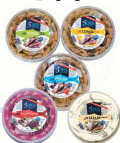
СЕЛЬДЬ "5 ОКЕАНОВ" В АССОРТИМЕНТЕ, 500 ГР