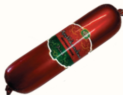
КОЛБАСА "МУСУЛЬМАНСКАЯ" П/К, СОВАД, 350 ГР