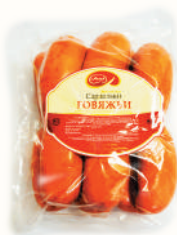
САРДЕЛЬКИ "ГОВЯЖЬИ" ОХЛ., АНКОМ, 1 КГ