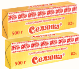
СПРЕД "СЕЛЯНКА" РАСТИТЕЛЬНО-ЖИРОВОЙ, 82%, 500 ГР