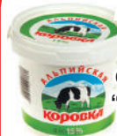
ПРОДУКТ СМЕТАННЫЙ "АЛЬПИЙСКАЯ КОРОВКА" 15%, 900 ГР