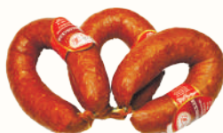
КОЛБАСА "КРАКОВСКАЯ" В/К, СОВАД, 300 ГР