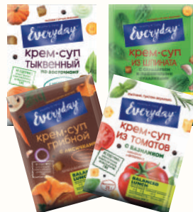
КРЕМ-СУП "ЭВРИДЕЙ" В АССОРТИМЕНТЕ, 25-30 ГР