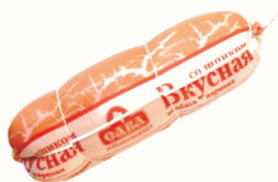
КОЛБАСА "ВКУСНАЯ СО ШПИКОМ" ВАР., САВА, 1 КГ