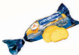
БАТОН "ГОРОДСКОЙ" В НАРЕЗКЕ, В/С, "ДАРНИЦА", 350 ГР