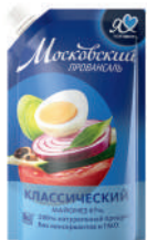
МАЙОНЕЗ "МОСКОВСКИЙ ПРОВАНСАЛЬ" КЛАССИЧЕСКИЙ, 67%, 420 МЛ