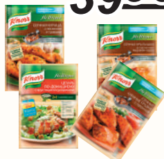
ПРИПРАВА "КНОРР": СОЧНАЯ КУРИЦА С ЧЕСНОКОМ И ТРАВАМИ; ЦЕЗАРЬ ПО-ДОМАШНЕМУ; КРЫЛЫШКИ В ГОРЧИЧНО- МЕДОВОМ СОУСЕ; КУРИНЫХ ГРУДОК С ПАПРИКОЙ, 23-30 ГР