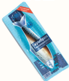
СКУМБРИЯ Т/П "5 ОКЕАНОВ", 650 ГР