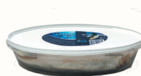
СЕЛЬДЬ Т/О "СПЕЦ. ПОСОЛ" "5 ОКЕАНОВ", 1 КГ