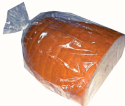
ХЛЕБ "БОКАТО" "ВОЛХОВХЛЕБ", 300 ГР