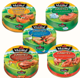
ПАШТЕТ "ХАМЕ" В АССОРТИМЕНТЕ, 117 ГР