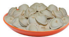
ПЕЛЬМЕНИ "МУСУЛЬМАНСКИЕ" С/М, 1 КГ