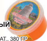
МЕД "МЕДОВЫЙ СПАС" ЛУГОВОЙ НАТ., 380 ГР