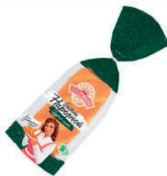
БАТОН "АЛАДУШКИН" НАРЕЗНОЙ 1 СОРТ "ДАРНИЦА", 350 ГР