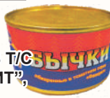
БЫЧКИ В Т/С "ФАВОРИТ", 240 ГР