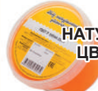
МЕД НАТУРАЛЬНЫЙ ЦВЕТОЧНЫЙ, 350 ГР