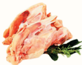
СУПОВОЙ НАБОР КУРИНЫЙ ОХЛ., 1 КГ