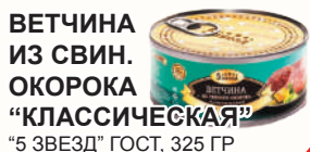
ВЕТЧИНА ИЗ СВИН. ОКОРОКА "КЛАССИЧЕСКАЯ" "5 ЗВЕЗД" ГОСТ, 325 ГР