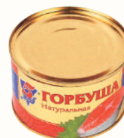
ГОРБУША НАТ. "5 МОРЕЙ", 250 ГР