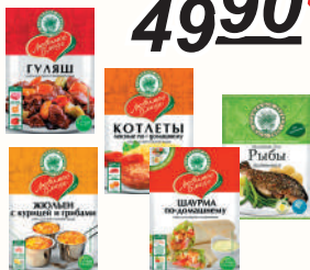
ПРИПРАВА "ВОЛШЕБНОЕ ДЕРЕВО": ДЛЯ КОТЛЕТ; ШАУРМЫ ПО-ДОМАШНЕМУ; ДЛЯ РЫБЫ ЛИМОННАЯ; ДЛЯ ГУЛЯША; ЖУЛЬЕН С КУРИЦЕЙ И ГРИБАМИ, 30-50 ГР