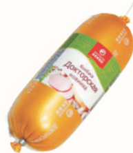
КОЛБАСА "ДОКТОРСКАЯ" НОВИНКА ВАР., ВНМД, 400 ГР