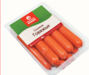
СОСИСКИ "ГОВЯЖЬИ" ОХЛ., ВНМД, 500 ГР