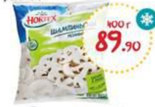
Шампиньоны ХОРТЕКС резаные