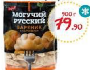
Вареники МОГУЧИЙ РУССКИЙ с картофелем