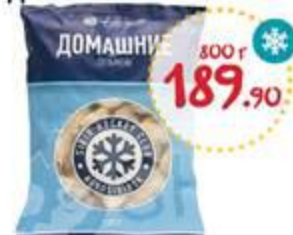
Пельмени ХК СИБИРЬ Домашние