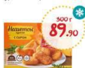
Наггетсы МИРАТОРГ куриные с сыром