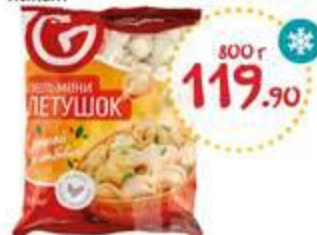
Пельмени НПФ Петушок пакет