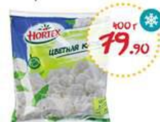
Цветная капуста ХОРТЕКС свежемороженая