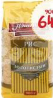
Рис НАЦИОНАЛЬ Золотистый