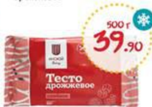
Тесто ИНСКОЙ слоеное дрожжевое