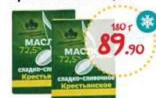
Масло сливочное ЛЕБЕДЕВСКАЯ АФ Крестьянское 72,5%