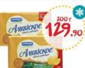
Масло сливочное КИПРИНО Алтайское 82%