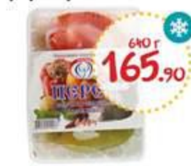
Перец ДОБРОДАР фаршированный