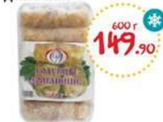
Голубцы ДОБРОДАР Домашние