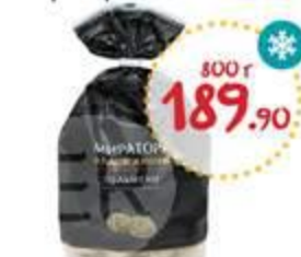
Пельмени МИРАТОРГ из мраморной говядины