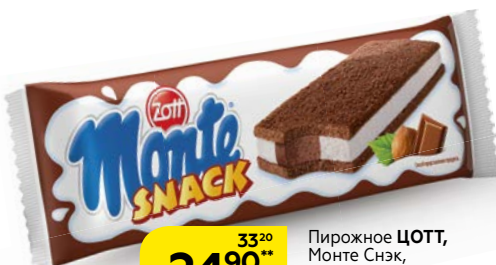
Пирожное ЦОТТ, Монте Снэк, ореховое, 29г