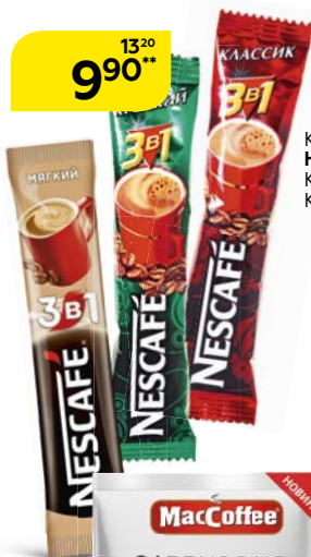
Кофе растворимый НЕСКАФЕ, 3 в 1: Классик/Мягкий/Крепкий, 16г