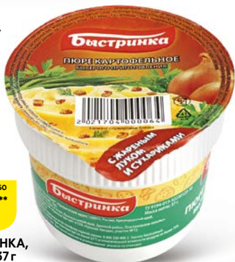
Пюре БЫСТРИНКА, с сухариками, 37г