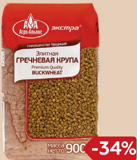
Крупа гречневая ЭКСТРА , Элитная (Агро-Альянс), 900г