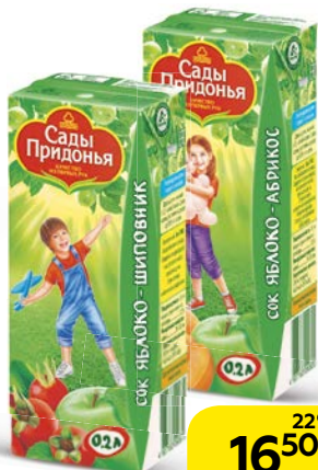
Сок САДЫ ПРИДОНЬЯ, в ассортименте***, 200 мл