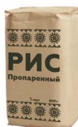
РИС Пропаренный, 1-й сорт, 800г