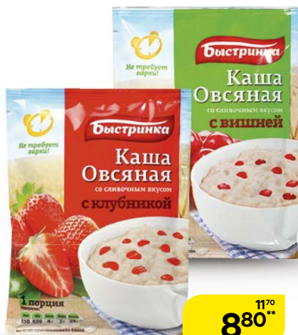
Каша овсяная БЫСТРИНКА, в ассортименте***, 41г