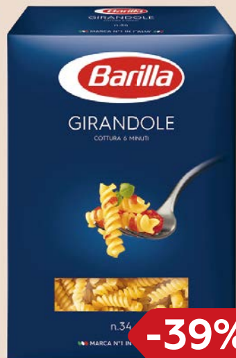
Макаронные изде- лия БАРИЛЛА , в ассортименте***, 500г