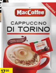
Кофе МАККОФЕ, 3 в 1, Капучино ди Торино, 25,5 г + Темный шоколад