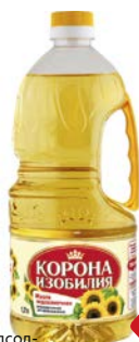
Масло подсол- нечное КОРОНА ИЗОБИЛИЯ , рафинированное, дезодорирован- ное, 1,7л