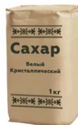
САХАР, Белый, кристаллический, 1кг