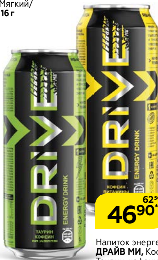
Напиток энергетический ДРАЙВ МИ, Кофеин-витамины/Таурин-кофеин-витамины, 449 мл