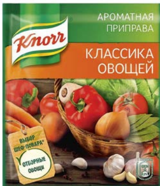
Приправа КНОПР, Классика овощей, 75г