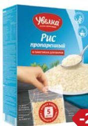
Рис УВЕЛКА , Длиннозерный пропаренный, 5 пакетиков x 80г