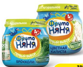
Пюре**** ФРУТОНЯНЯ, в ассортименте***, 80г