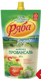
Майонез РЯБА, Провансаль, 67%, 400 г