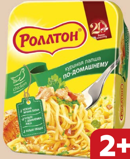
Лапша РОЛЛТОН, Куриная по-домашнему, 90 г