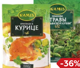
Приправа КАМИС, в ассортименте***, 10г/ 20г/ 25г/ 30г

* Цена за единицу товара при одновременной покупке 3 одинаковых акционных товаров