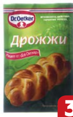
Дрожжи DR. OETKER® Сухие, 7 г