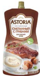
Соус майонезный АСТОРИЯ, Сметанный с грибами/ Сливочно-чесночный, 233 г