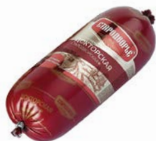
Колбаса ДОКТОРСКАЯ , Ста- родворье, вареная (Стародворские Колбасы), 500 г