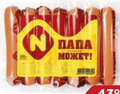
Сосиски ПАПА МОЖЕТ (ОМПК), 350 г