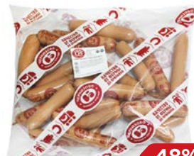
Сосиски ЧЕРКИЗОВО , сливочные (ЧМПЗ), 650 г