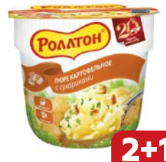
Пюре картофельное РОЛЛТОН, в стакане с сухари- ками, 40 г