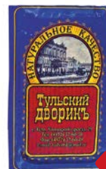
Продукт мясной ТУЛЬСКИЙ ДВОРИК , в желе, Крестьянский оригинальный, 400 г