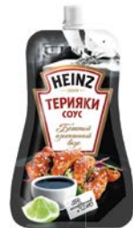
Соус ХАЙНЦ, Терияки/ Кисло- сладкий/ Сладкий чили, 230 г