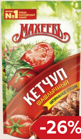
Кетчуп МАХЕЕВЪ Лечо/ Чили/ Шашлычный, 300 г