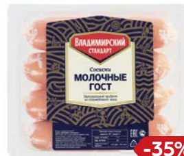
Сосиски МОЛОЧНЫЕ (Владимирский Стандарт), 480 г