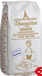
Мука пшеничная ФРАНЦУЗСКАЯ ШТУЧКА, Экстра, 2 кг

* Цена за единицу товара при одновременной покупке 3 одинаковых акционных товаров