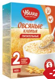
Хлопья овсяные УВЕЛКА, Пита- тельные, 400 г