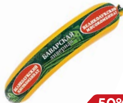
Колбаса БАВАРСКАЯ , Ливерная (Велико- лукский МК), 300 г