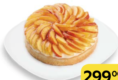
Торт КРОСТАТА , 800 г