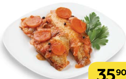
РЫБА ПОД МАРИНАДОМ, 100 г