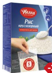
Рис УВЕЛКА , Круглозерный шлифованный, 5 пакетиков x 80 г