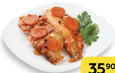
РЫБА ПОД МАРИНАДОМ, 100 г