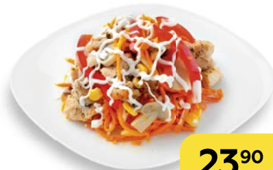
Салат ЭДЕЛЬВЕЙС , 100 г