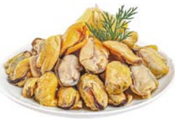
МЯСО МИДИЙ мороженое, 300 г

Представлен вариант сортировки продукции