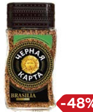
Кофе ЧЕРНАЯ КАРТА , Эксклюзив, Брази- лия, растворимый, 95 г