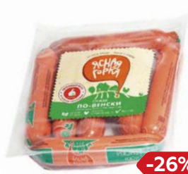
Сосиски ПО-ВЕНСКИ из мяса птиц (Пермская ПФ), 480 г