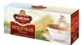
Чай черный МАЙСКИЙ , цейлон, отборный, 25 пакетиков