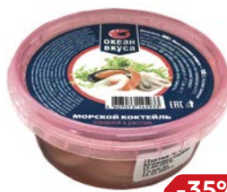
Коктейль морской КРУГЛЫЙ ГОД в рассоле (Ново-Мар), 300 г