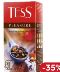
Чай черный ТЕСС® , Плежа, 25 пакетиков