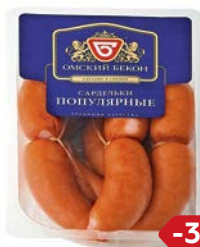
Сардельки ПОПУЛЯРНЫЕ (Омский Бекон), 100 г

* Цена за единицу товара при одновременной покупке 2 одинаковых акционных товаров