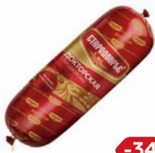
Колбаса ДОКТОРСКАЯ, вареная (Стародворские Колбасы), 100 г