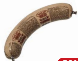
Колбаса ТРАДИЦИОННАЯ ливерная (Микоян), 400 г