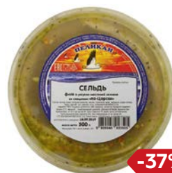
Сельдь БУХТА ПЕЛИКАНОFF® , По-царски, филе, 500 г