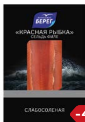
Сельдь БАЛТИЙСКИЙ БЕРЕГ , Красная рыба, слабосоленая, филе, 200 г