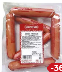
Сосиски МОЛОЧНЫЕ (Кунгурский МК), 580 г