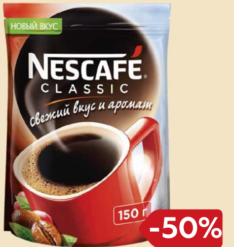
Кофе НЕСКАФЕ , Классик, раствори- мый, 150 г