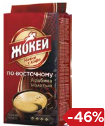
Кофе ЖОКЕЙ , По-восточному Арабика, молотый, 250 г