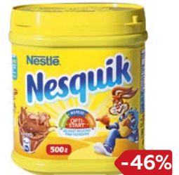
Какао НЕСКВИК , 500 г