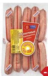
Сосиски МОЛОЧНЫЕ, По-царски, мини (Царицыно), 550 г