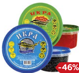
Икра ДАРЫ МОРЯ , Имитированная: Красная/Черная, 450 г

* Цена за единицу товара при одновременной покупке 2 любых акционных товаров