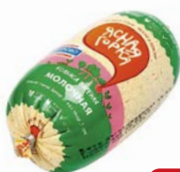
Колбаса МОЛОЧНАЯ, Ясная горка, вареная (Пермская ПФ), 400 г