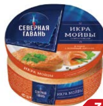
Икра мойвы СЕВЕРНАЯ ГАВАНЬ с колченым лососем, 180 г