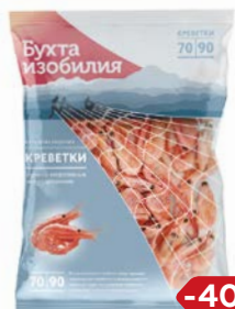
Креветки БУХТА ИЗОБИЛИЯ , Отборные, варено-мороженые 70/90, 850 г