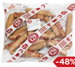
Сосиски ЧЕРКИЗОВО, сливочные (ЧМПЗ), 650 г