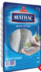
Филе сельди МАТИАС , Оригинал (Санта-Бремор), 250 г