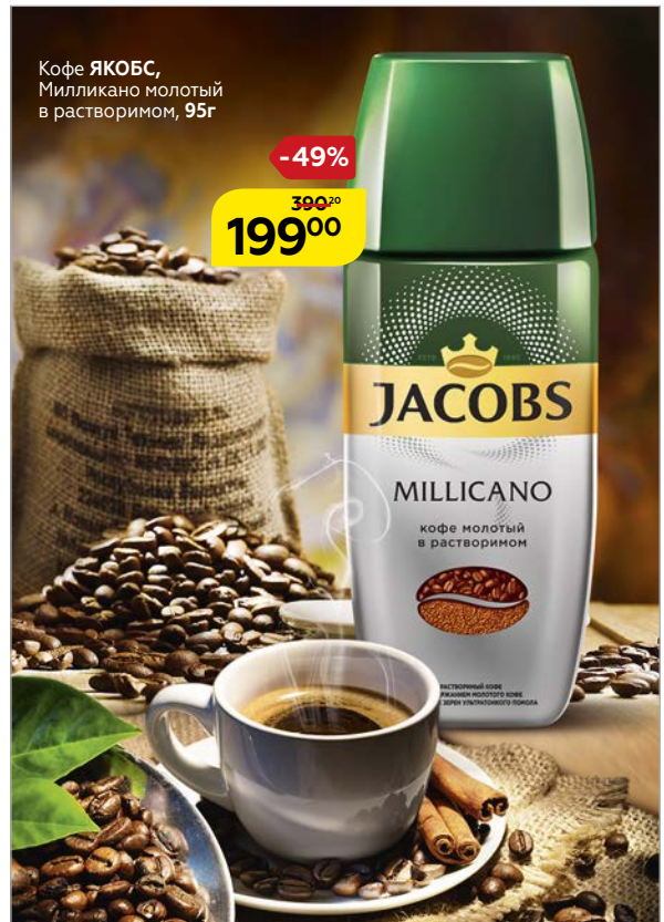
Кофе ЯКОБС , Милликано молотый в растворимом, 95 г