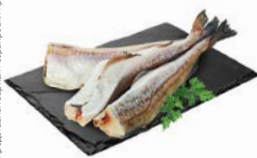
МИНТАЙ свежемороженый, 800 г

Представлен вариант сортировки продукции