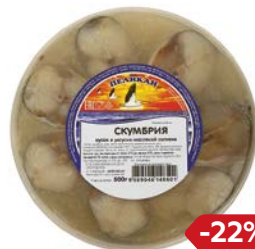
Скумбрия БУХТА ПЕЛИКАНОFF® , Кусочки в уксусно-масляной заливке, 500 г