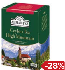
Чай черный АХМАД ТИ , Цейлонский, высо- когорный, 200 г