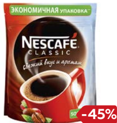
Кофе НЕСКАФЕ , Классик, раствори- мый, 500 г