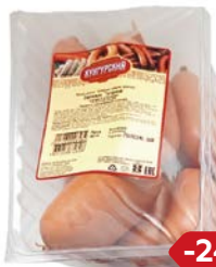
Сардельки ТАТАРСКИЕ (Кунгурский МК), 620 г