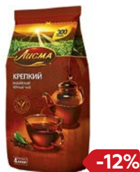
Чай черный ЛИСМА , Крепкий, 300 г