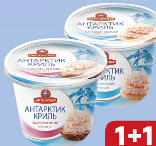
Паста из морепродуктов АНТАРКТИК КРИЛЬ Классическая/Подкопченная, 150 г