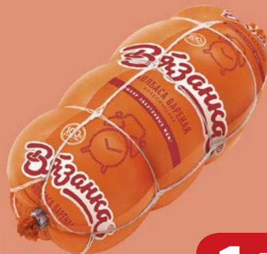
Колбаса КЛАССИЧЕСКАЯ, Вязанка, вареная (Стародворские Колбасы), 500 г