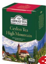
Чай черный АХМАД ТИ , Цейлонский, высокогорный, 200 г