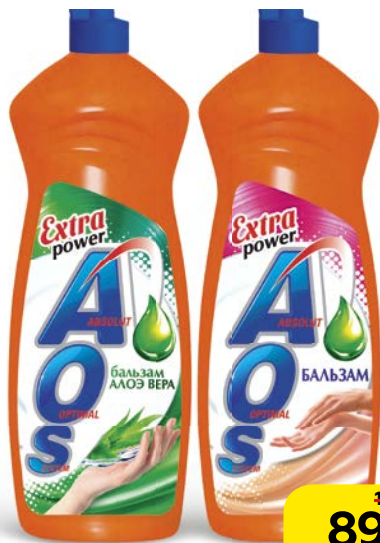
Гель для мытья посуды AOS® , С бальзамом алоэ вера/бальзам, 900мл