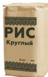
РИС , Круглый, 3 сорт, 800 г