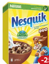
Завтрак готовый НЕСКВИК, Дуо, 375 г