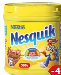
Какао НЕСКВИК , 500 г