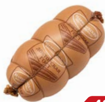
Колбаса ДОКТОРСКАЯ , ГОСТ вареная (Великолуцкий МК), 500 г

* Цена за единицу товара при единовременной покупке 2 одинаковых акционных товаров