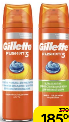
Гель для бритья GILLETTE® Фьюжн, ПроГлайд: освежающий/охлаждаю- щий/для чувствительной кожи, 200 мл