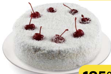
Торт ВИШНЕВАЯ ФАНТАЗИЯ , бисквитный, 700 г