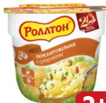
Пюре картофельное РОЛЛОН, в стакане с сухари- ками, 40 г

* Цена за единицу товара при единовременной покупке 3 одинаковых акционных товаров