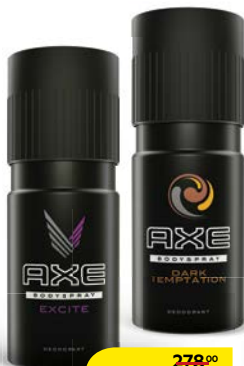
Дезодорант-спрей мужской AXE® , Дарк Темптейшн/Эксайт, 150 мл