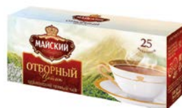
Чай черный МАЙСКИЙ , цейлон, отборный, 25 пакетиков