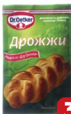
Дрожжи DR. OETKER® Сухие, 7 г