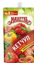
Кетчуп МАХЕЕВЪ Лечо/ Чили, 300 г