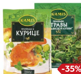
Приправа КАМИС, в ассортименте***, 10г/ 20г/ 25г/ 30г