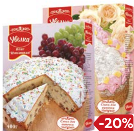
Смесь для выпечки УВЕЛКА Кекс: Нежный/ Изюминка, 400 г