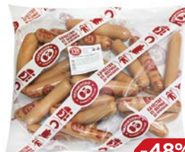
Сосиски ЧЕРКИЗОВО , сливочные (ЧМПЗ), 650 г