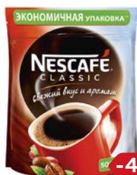
Кофе НЕСКАФЕ , Классик, растворимый, 500 г