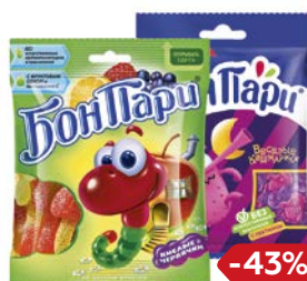
Мармелад БОН-ПАРИ , в ассортименте***, 65г/ 75г