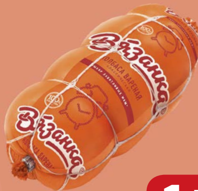
Колбаса КЛАССИЧЕСКАЯ , Вязанка , вареная (Стародворские Колбасы), 500 г