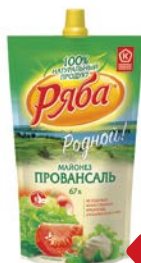
Майонез РЯБА, Провансаль, 67%, 400 г