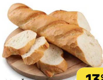
Багет ФРАНЦУЗСКИЙ , 250 г