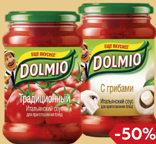
Соус ДОЛМИО , Традиционный томатный/ С грибами, 350 г