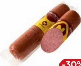
Сервелат КРЕМЛЕВСКИЙ , (ОМПК), 100 г