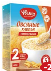
Хлопья овсяные УВЕЛКА, Пита- тельные, 400 г