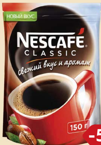
Кофе НЕСКАФЕ , Классик, растворимый, 150 г