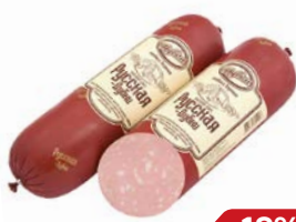
Колбаса РУССКАЯ (Дубки), 100 г