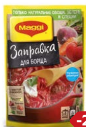
Заправка МАГГИ®, для борща, 250 г