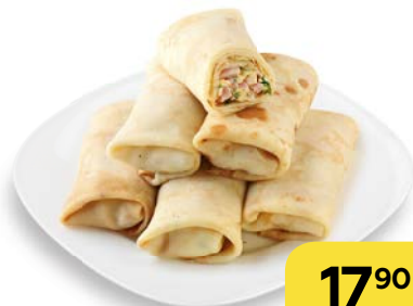
БЛИНЫ с ветчиной и сыром, 100 г