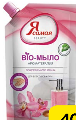
Мыло жидкое Я САМАЯ , Масло арганы и орхидеи, 500мл