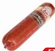
Сервелат ОХОТНИЧИЙ Дым Дымыч варено-копченый, мини (Агротэк), 350 г