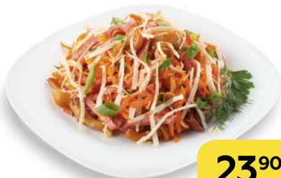
Салат ЗОЛОТОЕ РУНО , 100 г