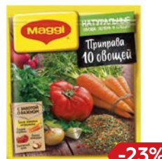
Приправа МАГГИ®, 10 овощей, 75 г

* Цена за единицу товара при единовременной покупке 4 одинаковых акционных товаров