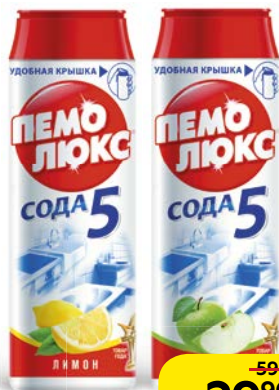
Средство чистящее ПЕМОЛЮКС , в ассортименте***, 480г