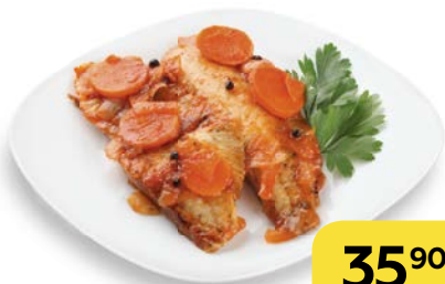
РЫБА ПОД МАРИНАДОМ , 100 г