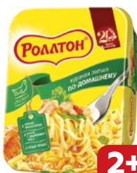
Лапша РОЛЛОН, Куриная по-домашнему, 90 г