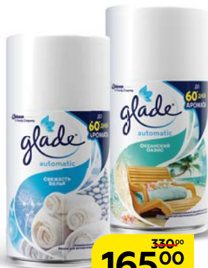
Освежитель воздуха ГЛЕЙД , в ассортименте***, 269 мл