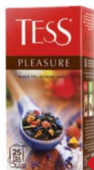
Чай черный ТЕСС® , Плежа, 25 пакетиков