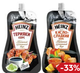
Соус ХАЙНЦ, Терияки/ Кисло- сладкий/ Сладкий чили, 230 г