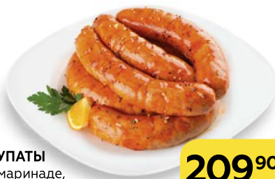
Полуфабрикат КУПАТЫ ИЗ СВИНИНЫ в маринаде, охлажденные, 1 кг