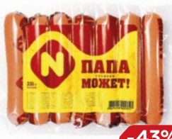
Сосиски ПАПА МОЖЕТ (ОМПК), 350 г