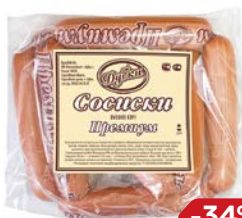
Сосиски ПРЕМИУМ (Дубки), 100 г