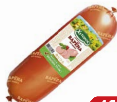
Колбаса ВАРЁНА , Хуторок, без шпика, (Регि- онэкопродукт), 100 г