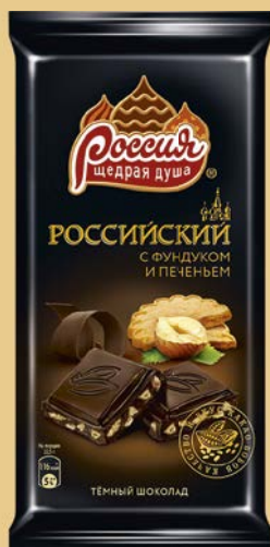
Шоколад РОССИЯ , в ассортименте***, 82г/ 90г