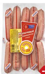
Сосиски МОЛОЧНЫЕ , По-царски, мини (Царицыно), 550 г