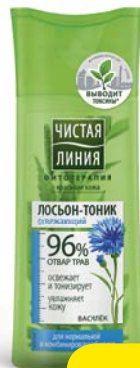
Лосьон-тоник ЧИСТАЯ ЛИНИЯ , Отвар целебных трав для ком- бинированной кожи, 100 мл