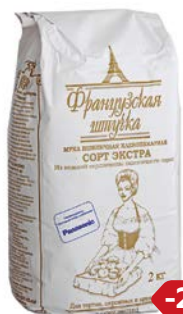
Мука пшеничная ФРАНЦУЗСКАЯ ШТУЧКА, Экстра, 2 кг