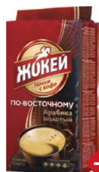
Кофе ЖОКЕЙ , По-восточному Арабика, молотый, 250 г