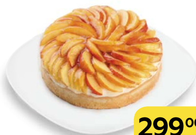
Торт КРОСТАТА , 800 г