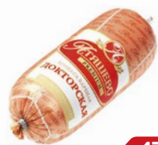
Колбаса ДОКТОРСКАЯ , вареная, премиум (МПК Атяшевский), 500 г