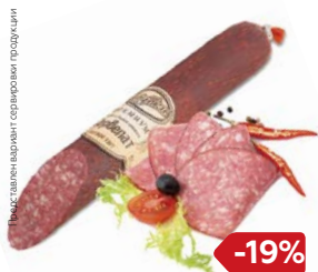
Сервелат ПРЕМИУМ варено- копченый (Дубки), 100 г