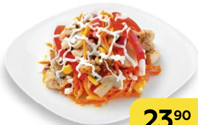
Салат ЭДЕЛЬВЕЙС , 100 г