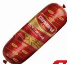
Колбаса ДОКТОРСКАЯ , вареная (Стародворские Колбасы), 100 г