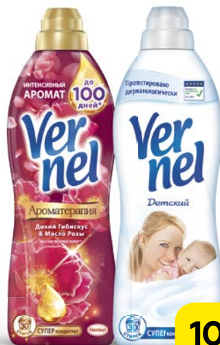
Кондиционер для белья VERNEL® , в ассортименте***, 910 мл