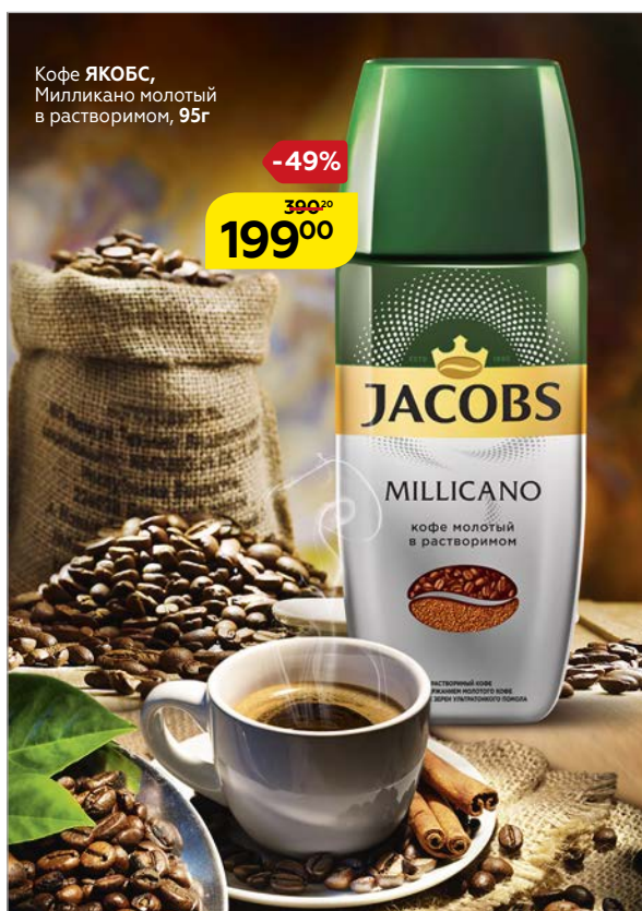
Кофе ЯКОБС , Милликано молотый в растворимом, 95 г