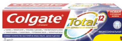
Паста зубная COLGATE® , Total 12, Профессиональное отбеливание, 75 мл