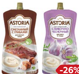
Соус майонезный АСТОРΙΑ, Сметанный с грибами/ Сливочно-чесночный, 233 г