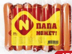
Сосиски ПАПА МОЖЕТ (ОМПК), 350 г