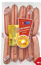
Сосиски МОЛОЧНЫЕ , По-царски, мини (Царицyno), 550 г