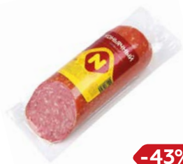
Сервелат КОНЬЯЧНЫЙ , Варено-копченый (ОМПК), 420 г