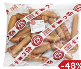
Сосиски ЧЕРКИЗОВО , сливочные (ЧМПЗ), 650 г