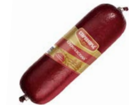
Сервелат КРЕМЛЕВСКИЙ , варено-копченый (Стародворские колбасы), 350 г