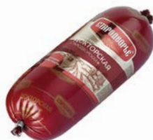
Колбаса ДОКТОРСКАЯ , Ста- родворье, вареная (Стародворские Колбасы), 500 г