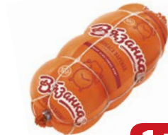
Колбаса КЛАССИЧЕСКАЯ , Вязанка, вареная (Стародворские Колбасы), 500 г