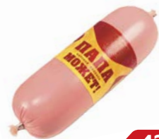
Колбаса ПАПА МОЖЕТ , Вареная (ОМПК), 500 г