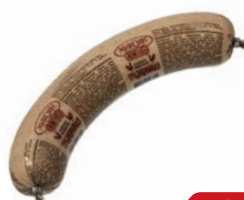
Колбаса ТРАДИЦИОННАЯ ливерная (Микоян), 400 г