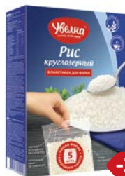
Рис УВЕЛКА , Круглозерный шлифованный, 5 пакетиков x 80г