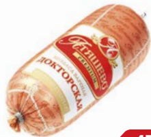
Колбаса ДОКТОРСКАЯ , вареная, премиум (МПК Атяшевский), 500 г