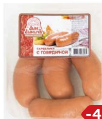
Сардельки С ГОВЯДИНОЙ , Дым Дымыч, Мини (Агротэк), 100 г