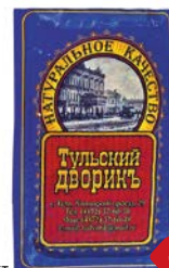
Продукт мясной ТУЛЬСКИЙ ДВОРИК , в желе, Крестьянский оригинальный, 400 г