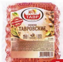
Сосиски ТАВРОВСКИЕ (Тавр), 600г