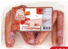
Сосиски ДЫМ ДЫМЫЧЪ , С говядиной (Агротэк), 400г