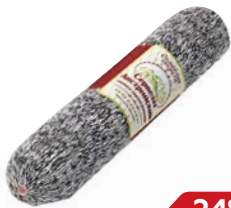
Сервелат СЕМЕЙНЫЕ СЕКРЕТЫ , Австрийский, варено-копченый, 350г