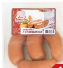
Сардельки С ГОВЯДИНОЙ , Дым Дымычъ, Мини (Агротэк), 100г