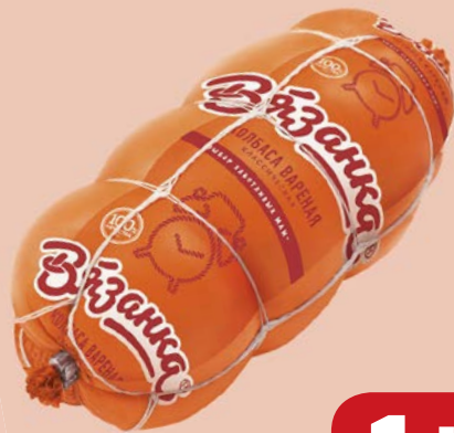
Колбаса КЛАССИЧЕСКАЯ , Вязанка, вареная (Стародворские Колбасы), 500г