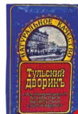
Продукт мясной ТУЛЬСКИЙ ДВОРИК , в желе, Крестьянский оригинальный, 400г