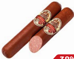
Сервелат ОРИГИНАЛЬНЫЙ , Полукопченый (Тавр), 100г