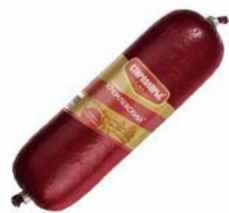
Сервелат КРЕМЛЕВСКИЙ , варено-копченый (Стародворские колбасы), 350г