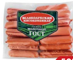
Сосиски МОЛОЧНЫЕ , ГОСТ (Великолукский МК), 650г