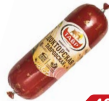
Колбаса ДОКТОРСКАЯ , Тавровская, варе- ная (Тавр), 700г