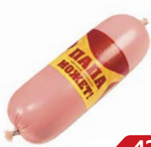
Колбаса ПАПА МОЖЕТ , Вареная (ОМПК), 500г