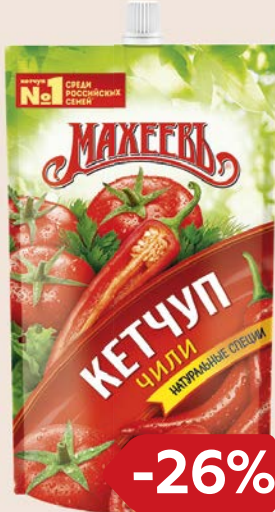
Кетчуп МАХЕЕВЪ Лечо/ Чили, 300 г