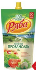
Майонез РЯБА, Провансаль, 67%, 400 г