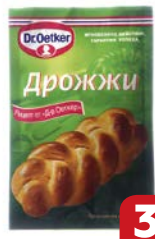
Дрожжи DR. OETKER® Сухие, 7 г