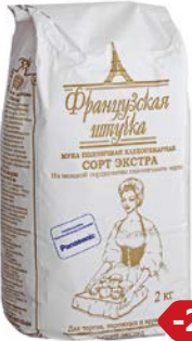
Мука пшеничная ФРАНЦУЗСКАЯ ШТУЧКА, Экстра, 2 кг

* Цена за единицу товара при одновременной покупке 3 одинаковых акционных товаров