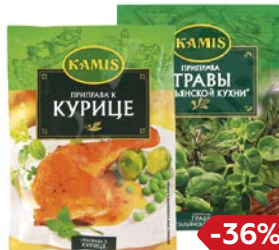
Приправа КАМИС, в ассортименте***, 10 г/ 20 г/ 25 г/ 30 г