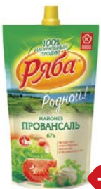
Майонез РЯБА, Провансаль, 67%, 400 г