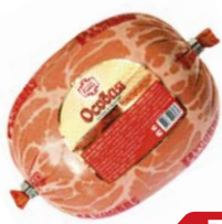
Колбаса ОСОБАЯ , Вареная (Русские колбасы), 600 г