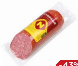
Сервелат КОНЬЯЧНЫЙ , Варено-копченый (ОМПК), 420 г