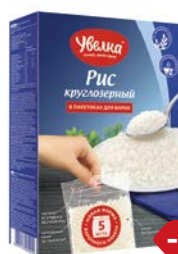
РИС УВЕЛКА , Круглозерный шлифованный, 5 пакетиков x 80г