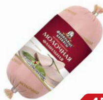
Колбаса МОЛОЧНАЯ , Вареная, мини (Фамильные Колбасы), 400 г