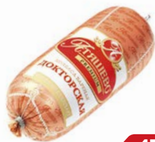
Колбаса ДОКТОРСКАЯ , вареная, премиум (МПК Атяшевский), 500 г