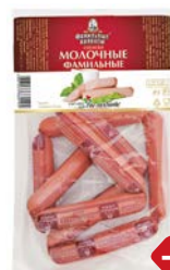
Сосиски МОЛОЧНЫЕ (Фамильные колбасы), 600 г