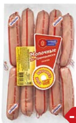
Сосиски МОЛОЧНЫЕ , По-царски, мини (Царицыно), 550 г