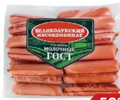
Сосиски МОЛОЧНЫЕ , ГОСТ (Великолукский МК), 650 г