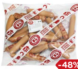
Сосиски ЧЕРКИЗОВО , сливочные (ЧМПЗ), 650 г