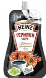
Соус ХАЙНЦ, Терияки/ Кисло- сладкий/ Сладкий чили, 230 г