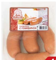
Сардельки С ГОВЯДИНОЙ , Дым Дымычъ, Мини (Агротэк), 100 г