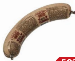
Колбаса ТРАДИЦИОННАЯ ливерная (Микоян), 400 г