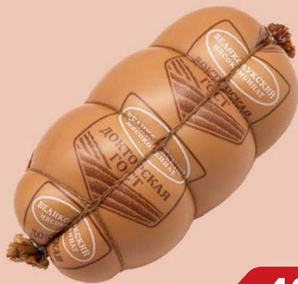
Колбаса ДОКТОРСКАЯ , ГОСТ вареная (Великолукский МК), 500 г