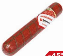
Сервелат ЮБИЛЕЙНЫЙ , Генеральские колбасы, варено- копченый (Агротэк), 400 г