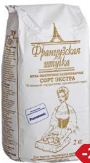
Мука пшеничная ФРАНЦУЗСКАЯ ШТУЧКА, Экстра, 2 кг

* Цена за единицу товара при одновременной покупке 3 одинаковых акционных товаров