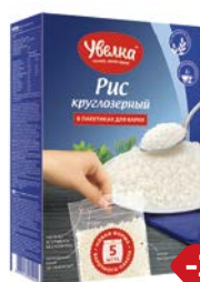
РИС УВЕЛКА , Круглозерный шлифованный, 5 пакетиков x 80г