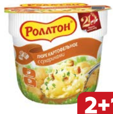
Пюре картофельное РОЛЛТОН, в стакане с сухари- ками, 40 г