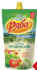
Майонез РЯБА, Провансаль, 67%, 400 г