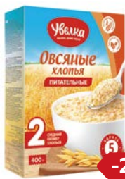
Хлопья овсяные УВЕЛКА, Пита- тельные, 400 г