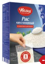
Рис УВЕЛКА , Круглозерный шлифованный, 5 пакетиков x 80г