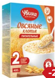
Хлопья овсяные УВЕЛКА, Пита- тельные, 400 г