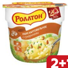
Пюре картофельное РОЛЛТОН, в стакане с сухари- ками, 40 г