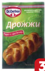
Дрожжи DR. OETKER® Сухие, 7 г