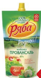
Майонез РЯБА, Провансаль, 67%, 400 г