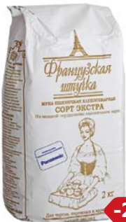
Мука пшеничная ФРАНЦУЗСКАЯ ШТУЧКА, Экстра, 2 кг

* Цена за единицу товара при одновременной покупке 3 одинаковых акционных товаров