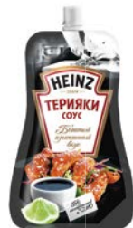
Соус ХАЙНЦ, Терияки/ Кисло- сладкий/ Сладкий чили, 230 г