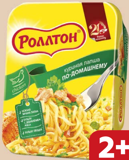
Лапша РОЛЛТОН, Куриная по-домашнему, 90 г