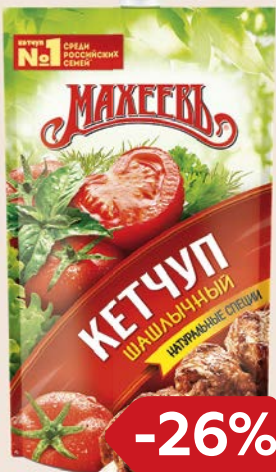
Кетчуп МАХЕЕВЪ Лечо/ Чили/ Шашлычный, 300 г