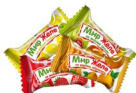
Конфеты МИР ЖЕЛЕ , Фрук- товый микс, 100 г