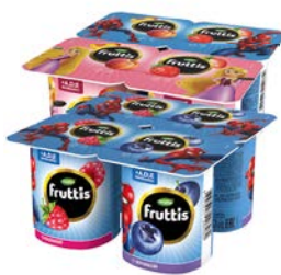
Продукт йогуртный ФРУТТИС , Герои: Малина-черника/ Персик-клубника, 110 г