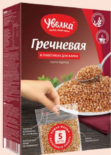
Крупа гречневая УВЕЛКА , Экстра, 5 пакетиков x 80 г