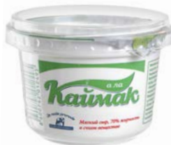
Сыр мягкий А ЛА КАЙМАК , 70%, 250 г