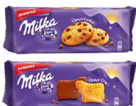
Печенье МИЛКА Чоко Куки, 168 г/ Чоко Му, 200 г