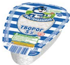
Творог ПРОСТОКВАШИНО , 5%, 220 г