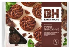
Мини-пирожные БЭЙКЕР ХАУС , Трюфель, 240 г