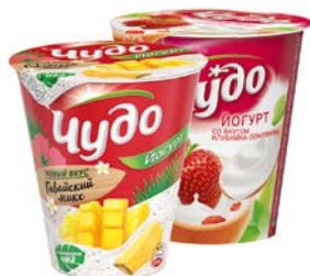
Йогурт ЧУДО в ассортименте***, 290 г