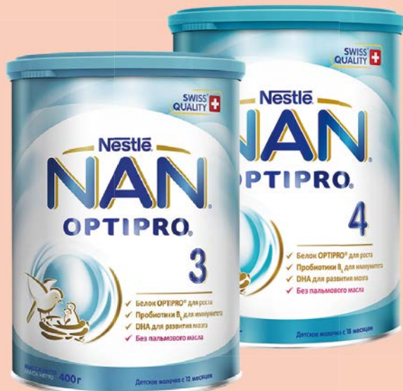
Молочко детское** НАН 3/4 , 400 г