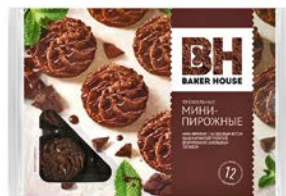
Миши-пирожные БЭЙКЕР ХАУС, Трюфель, 240 г