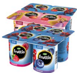
Продукт йогуртный ФРУТТИС, Герои: Малина-черника/ Персик-клубника, 110 г