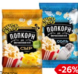
Попкорн CHICO & RICO® , для микроволновой печи: Карамель/ Сыр/ С солью, 85 г