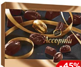
Конфеты АССОРТИ (Конти-Рус), 235 г