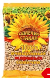
Ядра подсолнечника СЕМЕЧЕК СТАКАН , Обжаренные, 100 г