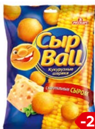
Шарики кукурузные СЫРBALL® , Сыр, 140 г