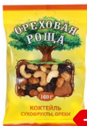
Коктейль из сухофруктов и орехов ОРЕХОВАЯ РОЩА , 160 г