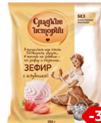
Зефир СЛАДКИЕ ИСТОРИИ , С кусочками клубквы/ С клубни- кой, 250 г