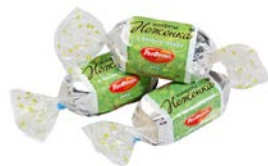
Конфеты НЕЖЕНКА (Рот Фронт), 100 г