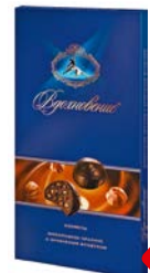
Конфеты ВДОХНОВЕНИЕ , Шоколадные пра- лине, с дробленным фундуком, 400 г