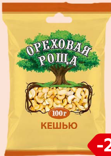
Кешью ОРЕХОВАЯ РОЩА жареный, 100 г