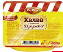
Халва ДРУЖБА , с арахисом (Рот Фронт), 250 г