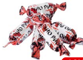
Конфеты ЧИО-РИО (КДВ), 100 г