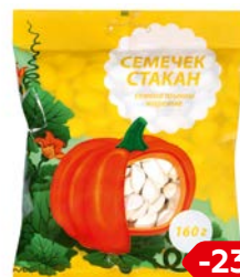
Семена тыквы СЕМЕЧЕК СТАКАН , Обжаренные, 160 г