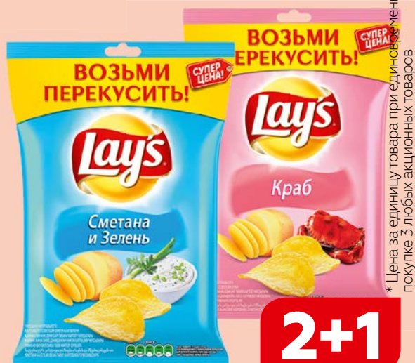
Чипсы LAY'S® , Сметана и зелень/Краб, 40 г