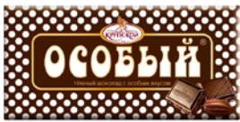
Шоколад ОСОБЫЙ (Фабрика Крупской), 90 г