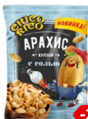
Арахис CHICO & RICO® , жареный соленый, 80 г

* Цена за единицу товара при единовременной покупке 3 любых акционных товаров