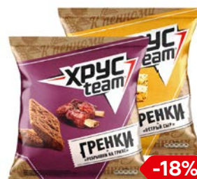
Гренки ХРУСТИМ , Острый сыр/ Копченый лосось/ Ребрышки на гриле, 105 г