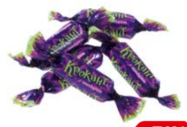
Конфеты КРОКАНТ (КДВ), 100 г