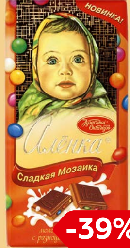
Шоколад молочный АЛЕНКА , в ассортименте*** 100 г