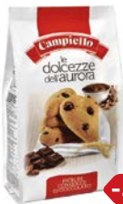
Печенье CAMPIELLO®, С кусочками шоколада, 350 г