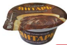
Сыр плавленный ЯНТАРЬ шоколад- ный, 80 г