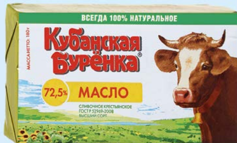
Масло сливочное КУБАНСКАЯ БУРЕНКА, Кре- стьянское, 72,5%, 180 г