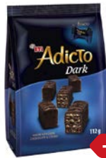
Вафли АДИКТО мини, в шоколаде, 112 г