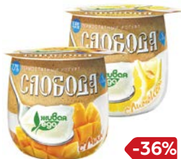
Бийогурт СЛОБОДА Термо- статный: Манго/ Лимон/Малина, 170 г