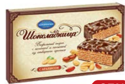
Торт вафельный ШОКОЛАДНИЦА, с арахисом, 430 г