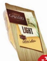
Сыр ЛАЙТ, Чиз гэллэри, нарезка, 20%, 150 г