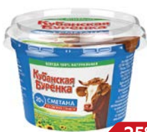
Сметана КУБАНСКАЯ БУРЕНКА, 20%, 180 г