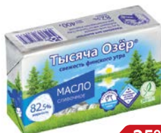
Масло слад- косливочное ТЫСЯЧА ОЗЕР 82,5%, 400 г