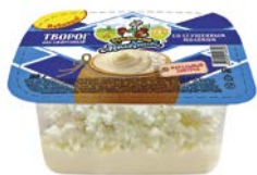
Творог КУБАНСКИЙ МОЛОЧНИК, обезжиренный, со сгущенкой, 160 г