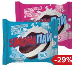
Пирожное СИМОНА Пай: Нежное суфле/ Со вкусом клубники, 55 г