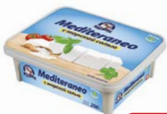
Сыр МЕДИТЕРАНЕО, Брынза, 250 г