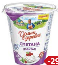
Сметана ДОМИК В ДЕРЕВНЕ взбитая 14%, 185 г