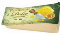
Сыр ДОЛЬЧЕ, Пармезан, 200 г