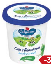
Сыр САВУШКИН, Творожный, воз- душный с зеленью, 150 г