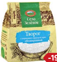
Творог СЕЛО ЗЕЛЕНОЕ, обезжиренный, 200 г