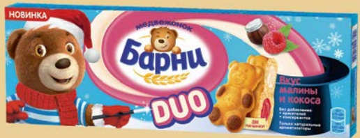
Пирожное бисквит- ное МЕДВЕЖОНОК БАРНИ Дуо, малина-кокос, 150 г