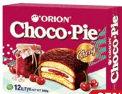
Бисквит ШОКО PIE®, Черри, в шоколаде, 360 г