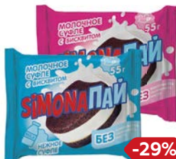
Пирожное СИМОНА Пай: Нежное суфле/ Со вкусом клубники, 55 г