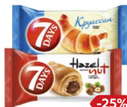
Круассан 7DAYS®, Крем фундук/ Ваниль, 65 г