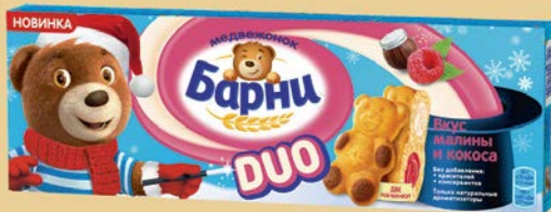
Пирожное бисквит- ное МЕДВЕЖОНОК БАРНИ Дуо, малина-кокос, 150 г