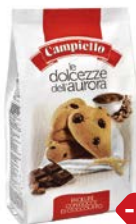
Печенье САМПИЕЛЛО®, С кусочками шоколада, 350 г