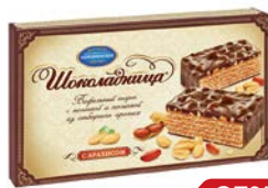
Торт вафельный ШОКОЛАДНИЦА, с арахисом, 430 г