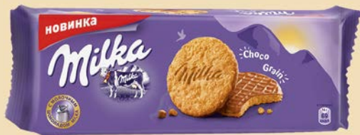
Печенье МИЛКА, Чоко Грэйн, 168 г