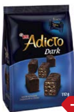
Вафли АДИКТО мини, в шоколаде, 112 г