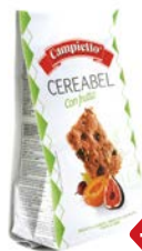
Печенье САМПИЕЛЛО®, Фруктовое, 220 г