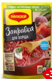
Заправка МАГГИ®, для борща, 250 г