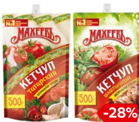
Кетчуп МАХЕЕВЪ Шашлычный/Татарский, 500 г