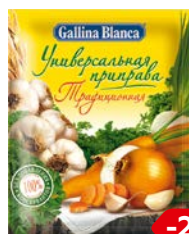
Универсальная приправа GALLINA BLANCA® Традиционная, 75 г