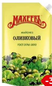
Майонез МАХЕЕВЪ, Оливковый, 50,5%, 770 г