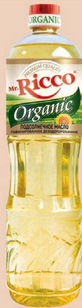
Масло подсолнечное МИСТЕР РИККО, Органик рафинированное, дезодорированное, 1л