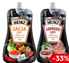
Соус ХАЙНЦ, Барбекю/Чили/Сальса, 230 г