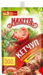
Кетчуп МАХЕЕВЪ, Шашлычный, 500 г