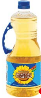
Масло подсолнечное ЗОЛОТАЯ СЕМЕЧКА рафинированное, дезодорированное, 1,8 л