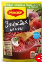
Заправка МАГГИ®, для борща, 250 г