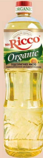
Масло подсолнечное МИСТЕР РИККО, Органик рафинированное, дезодорированное, 1л