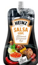
Соус ХАЙНЦ, Барбекю/ Чили/ Сальса, 230 г