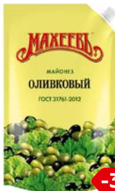
Майонез МАХЕЕВЪ, Оливковый, 50,5%, 770 г