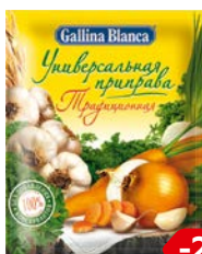
Универсальная приправа GALLINA BLANCA® Традиционная, 75 г