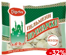
Пельмени ПО-ТАТАРСКИ (Иола), 400 г