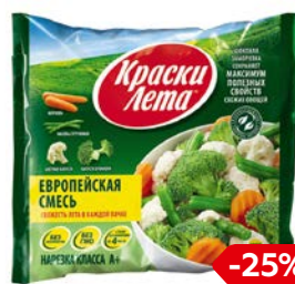
Смесь овощная КРАСКИ ЛЕТА, Европейская, заморозженная, 400 г

* Цена за единицу товара при одновременной покупке 2 одинаковых акционных товаров