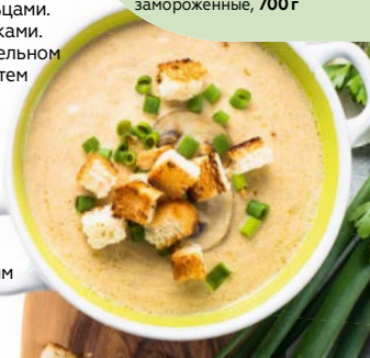
Шампиньоны СЕМЕЙНЫЕ СЕКРЕТЫ, Резаные, быстрозамороженные, 700 г

* Цена за единицу товара при одновременной покупке 2 одинаковых акционных товаров