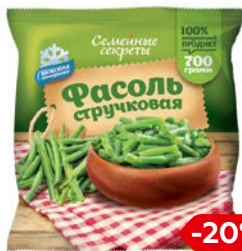
Фасоль стручковая СЕМЕЙНЫЕ СЕКРЕТЫ (резаная), 700 г