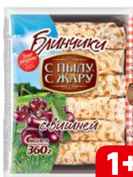
Блинчики С ПЫЛУ С ЖАРУ, с вишней, 360 г