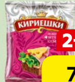
Сухарики КИРИЕШКИ, холодец/ бекон/ветчина, 40 г