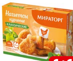
Наггетсы куриные МИРАТОРГ, Классические, 300 г