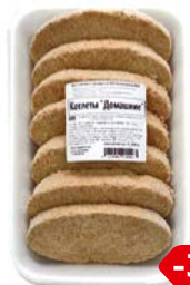
Котлеты ДОМАШНИЕ (ИП Хакимьянова), 700 г

* Цена за единицу товара при одновременной покупке 2 одинаковых акционных товаров