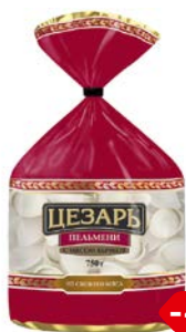
Пельмени ЦЕЗАРЬ, с мясом бычков, 750 г