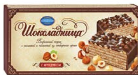
Торт вафельный ШОКОЛАДНИЦА , С фундуком, 270 г