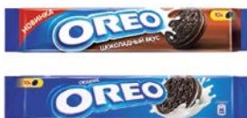
Печенье ОРЕО , Классическое/С шоколадной начинкой, 95 г