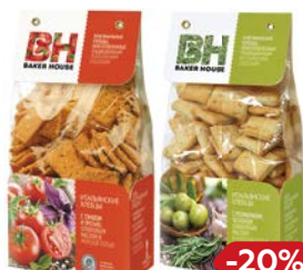
Крекер БЭЙКЕР ХАУС С томатом и орегано/С розмарином и чесноком, 250 г