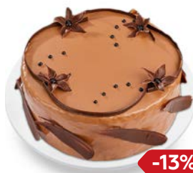
Торт БЕЛЬГИЙСКИЙ ШОКОЛАД бисквитный (Тортыня), 850 г