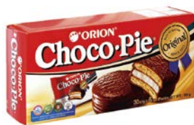
Печенье ЧОКО ПАЙ , В шоколадной глазури, 180 г