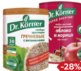
Хлебцы Д-Р КОРНЕР , Гречневые с витаминами, 100 г; Злаковый коктейль, яблоко и корица, 90 г