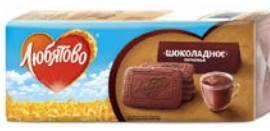
Печенье ЛЮБЯТОВО , шоколадное, 335 г