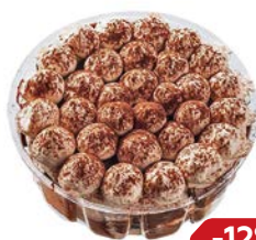
Пирожное ТИРАМИСУ (Тортыня), 150 г