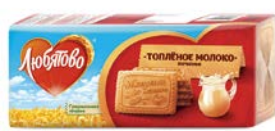
Печенье ЛЮБЯТОВО , Топленое молоко, 400 г