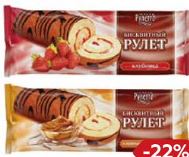
Рулет СИНЬОР-РУЛЕТТО Бисквитный: Вареная гущенка/Клубника, 200 г