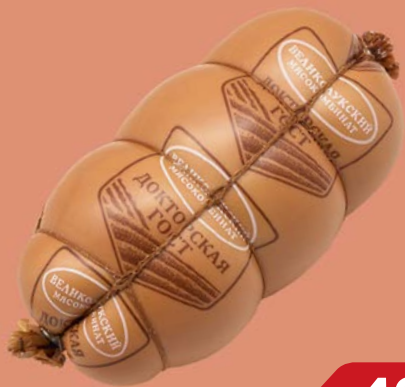
Колбаса ДОКТОРСКАЯ, ГОСТ вареная (Великолукский МК), 500 г