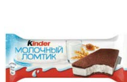
Пирожное КИНДЕР , Молочный ломтик, 28 г