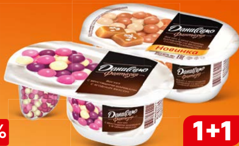
Йогурт ДАНИССИМО , Фантазия, густой, ягодные шарики/солёная карамель/с хрустящими шариками, 105 г