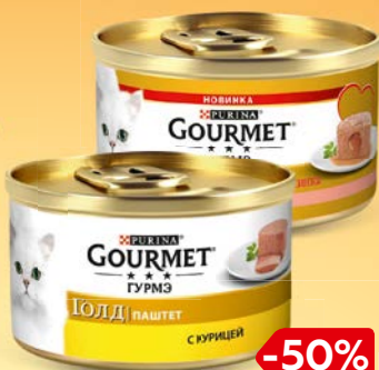
Корм для кошек GOURMET® , Голд, паштет, в ассорти- менте**, 85 г