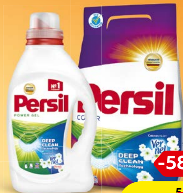
PERSIL® , в ассортименте**, порошок стиральный 3 кг/ 2,43 кг/ Гель для стирки, 20 стирок