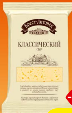
Сыр БРЕСТ-ЛИТОВСКИЙ , Классический, 45%, 200 г