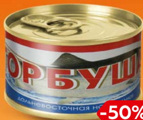
Горбуша МОРСКАЯ УДАЧА натуральная, 240 г