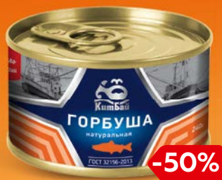
Горбуша КИТБАЙ натуральная, 240 г