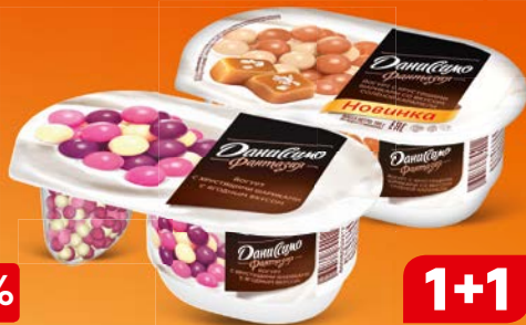
Йогурт ДАНИССИМО, Фантазия, густой, ягодные шарики/солёная карамель/с хрустящими шариками, 105 г